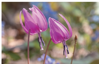
春の訪れと共に咲く高山植物のカタクリ