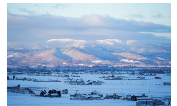
水田は雪で覆われ美しい雪原に