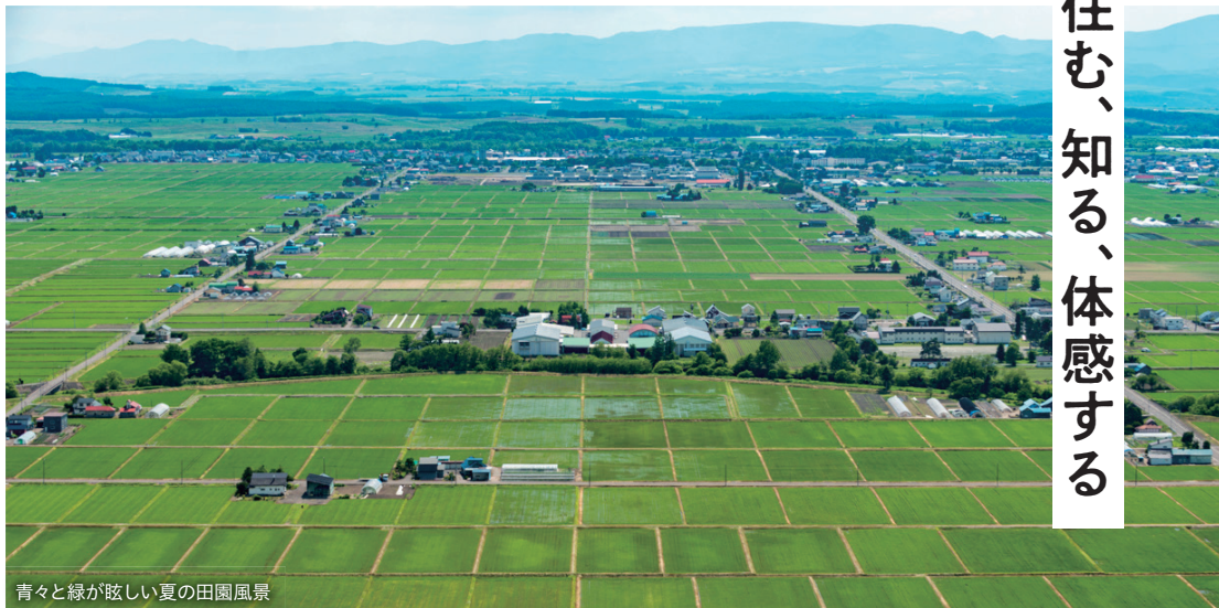
青々と緑が眩しい夏の田園風景