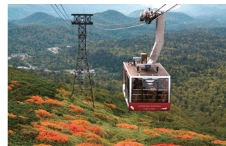
日本一早い紅葉(旭岳)