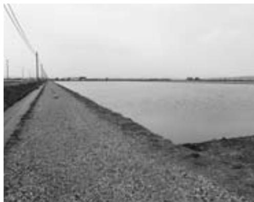
妹背牛町の大規模水田（昨年6月）

昨年10月から町内の耕作者を対象に計画概要の地区別説明会、農事組合懇談会を行い、事業概要を定めました。今後は6月以降、町内外の全地権者（約900人）へ