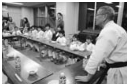
今年の鏡開きもにぎやかに(1月16日、B&G海洋センター)

るほど辛い。超えるのは大きな壁だった」。昨年6月、見事3段昇段を果たし、ようやく子供たちを教える立場に。