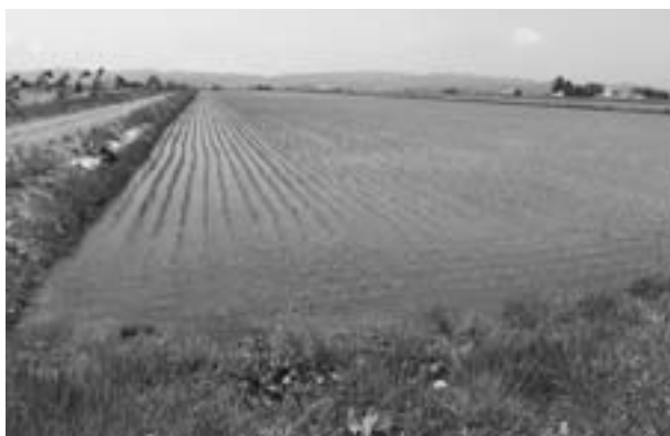
すでに水田再編整備事業が先行している空知管内由仁町の大規模水田（昨年6月）

のための水田の大型化、ほ場の透水性改善のための暗きよ排水、その他用排水整備、除礫（れき）整備。標準的には、町道で囲まれている545アール（300間）1区画（1間は約1・8アール）を12枚のほ場に整備します。水田1枚当たりの面積は平均2・4アールとなり、1枚当たりの水田面積は現在の約7倍に拡大します。