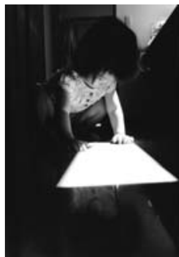
第5回ひがしかわ大写真展 町外一般部門 グランプリ 「陽だまり」