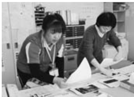
職場の東神楽町社会福祉協議会ホームヘルプサービスセンターで

訪問介護、入浴サービス、有償移送と、日々の仕事は連日々な業務の連続。介護福祉士の資格も取得し、ケアマネジャーの