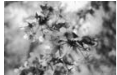
陽光の春満開 (キトウシ森林公園のエゾヤマザクラ)