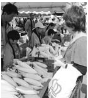
東川町農協「大雪清流てっぺんスクール」の子供たちも自分たちが作ったトウモロコシを直売

9月7日、8の両日、キトウシ森林公園で第55回から楽しくフェスティバルが開かれました。