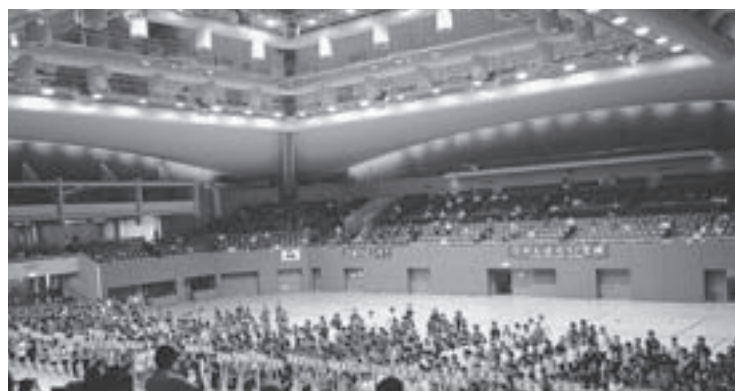
全国定時制通信制高校体育大会の卓球大会開会式(今年8月6日、東京・駒沢オリンピック公園総合運動場体育館)

北海道旭川東高校定時制4年、19歳。全国高等学校定時制通信制体育大会第46回卓球大会(8月6～8日・東京駒沢オリンピック公園総合運動場体育館)で全国ベスト16。旭川市内の市民卓球クラブチーム「翔くんとゆかいな仲間たち」所属。