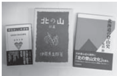
大雪山の登山史が分かる書籍の一例

那須局長から「ところで、旭岳とスキーの関係、歴史はいつごろからなのでしょうか」と問い合わせをいただきました。そこで開いたのが伊藤秀五郎著「北の山 続編」（1976年、茗溪堂刊）。その中の大雪