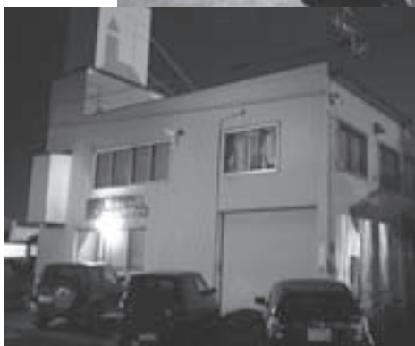
「道場」と呼ぶ練習場は旭川市内の元家具工場

旭川東高校定時制に進学後入部した卓球部は、自分も含めて部員4人。その後毎年1人ずつ部員が減り、4年生でついに1人だけに。そんな少人数の活動の中で、2年生から連続3回全国出場を果たしてつかみ取った集大成の成果でした。