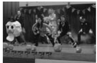
めだかクラブのハロウィンパーティー (昨年10月、農村環境改善センター)