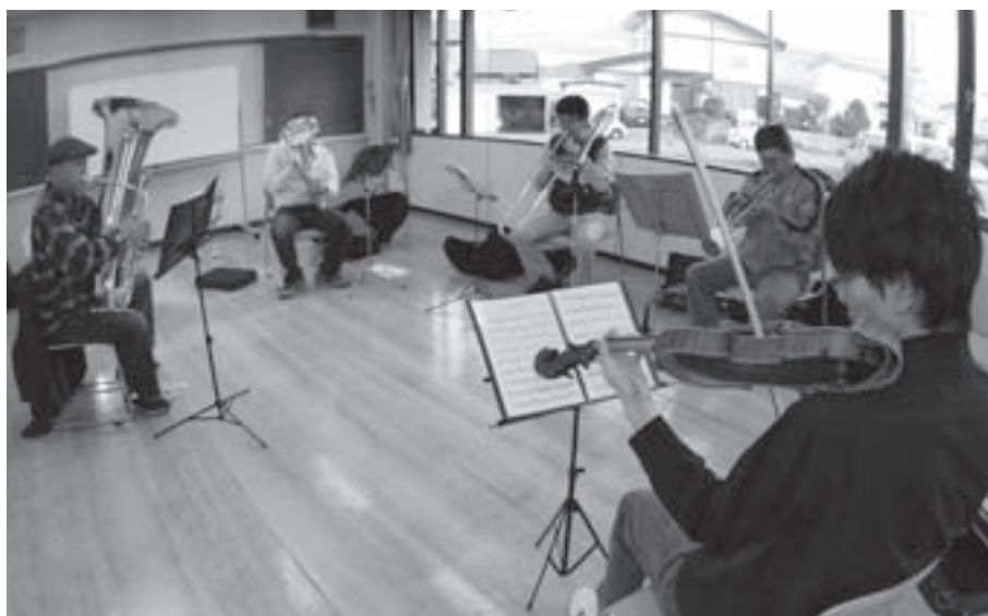
農村環境改善センターで

「楽器を持って、一緒に演奏する仲間がいて、楽しくやるのが一番」。そんな仲間が旭川市内、東神楽町からも集まって町内に新しい音楽アンサンブルが誕生しました。その一人としてファゴットを奏でています。音楽の仲間たちとの新しい出会い、デビュー演奏会に向けて高まり始めた心地よい緊張を楽しんでいます。