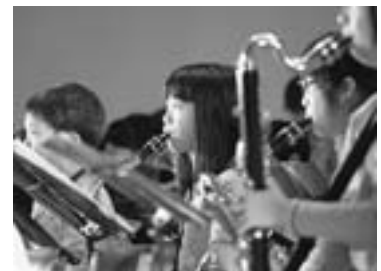
東川小学校スクールバンドの熱演 (昨年の町民文化祭から)