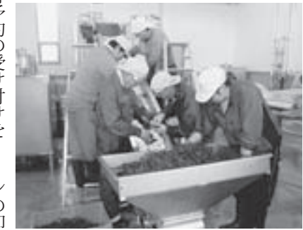
東川振興公社職員がぶどうの仕込み作業をしました=昨年10月、10R(トアール)農場ぶどう酒醸造所で

東川産ぶどう100%原料の赤ワイン「ひがしかわワイン2014」(仮称)が今秋、いよいよ新登場します。町では町民ひがしかわ株主の皆さんにいち早く新酒を味わって