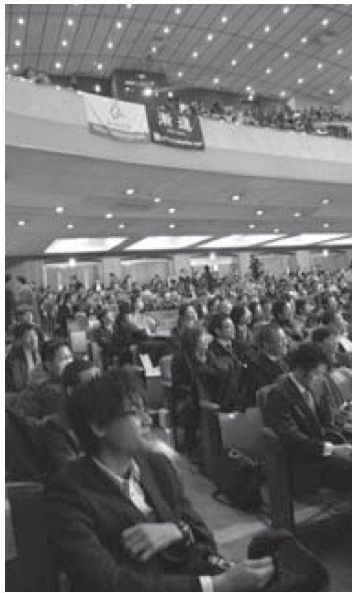
JA全国青年大会で発表した会場(全国6ブロックを勝ち抜いた各地代表の応援団で臨席までいっしょ) 2月12日、東京日比谷公会堂

手術。長い入院生活と高齢が重なって、仕事することが出来なくなつてしまいました。「農繁期の手伝い程度しかやったことがなく、ハウスの管理の仕方、苗の水やり、温度管理を口頭で教えてもらつた。けれどもまくいかなかつた」そうです。じいちゃんのけがで真剣に農業の厳しさと向き合うことに。青年部の仲間とも情報交換をするようになり、青年の主張への出場を勧められて臨んだ大会。祖父の背中から学んだ農家の心、農業への取り組みに目覚めた思いを込めたスピーチでした。