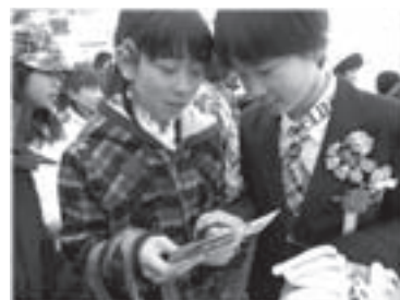
卒業の日 (昨年3月東川小学校で)