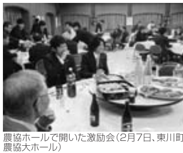
農協ホールで開いた激励会(2月7日、東川町農協大ホール)

歴代の町内先輩農家の中で、東北・北海道ブロック出場まで進んだのは過去2人だけとか。初の全国出場。壮行激励会で練習成果を披露し、持ち時間10分間という制限時間に対して、9分58秒とジャストタイムで発表してみせ、みんなの期待が膨らみました。