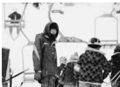
農閑期のスキー場アルバイトはこととして3シーズン目になりました(旭川市台場のサンタプレゼントパークで)

そのメインゲレンデはカムイスキーリンクス(旭川市神居古潭)。「行き帰りの途中にあるから好都合」とサンタプレゼントパーク(同市台場)で始めたスキー場アルバイトは3シーズン目を迎え、