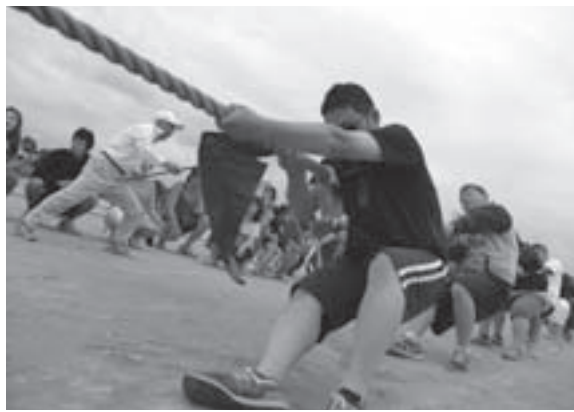
一番の盛り上がり、全町綱引きで2年連続優勝の「展望閣」チーム

チーム力を見せて圧倒しました。全町綱引き競技は、昨年2年ぶりに優勝した第二地区の展望閣チームが2年連続優勝しました。