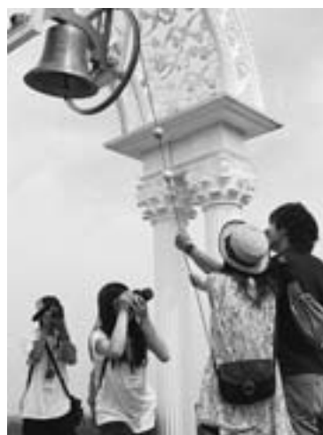
幸せ誓う2人を激写 (昨年写真甲子園=宮城県迫桜高校、 上富良野町日の出公園)