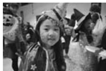
めだかクラブのハロウィンパーティー (昨年10月、農村環境改善センター)