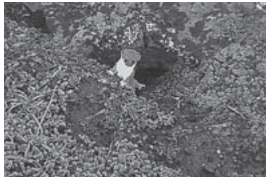
ひよっこり姿を見せたオコジョ

Nature Column (ネイチャーコラム) 自然ガイドなどで活躍する人々をリレーしています。