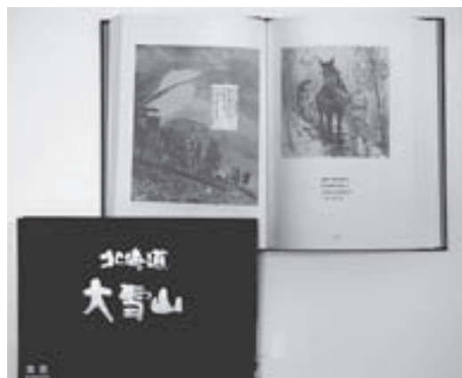
国立公園50周年記念写真集「北海道大雪山」と、大雪山の演習を記録した「追憶」の中の山中行軍写真

写真集ですから記述はあっさり短めで、演習の詳しいことは分かりません。ところが写真集発行が発端となつて、埋もれていた戦前の記憶は、思わぬ展開で史実の追補が完成していたのです。