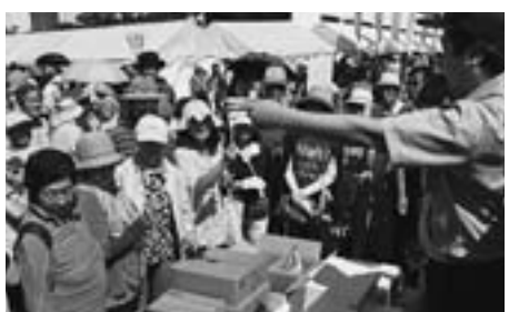
キョクイチせり人と来場者が会場で野菜の値段をせり合い

8月31日、東川町農協主催の第12回大雪清流てつべんまつりが同農協駐車場特設会場で開かれました。町内の農家が生産した東川産の「東川米」「ひがしかわサラダ」の産直販売とゲーム、野菜詰め放題販売、清酒「東川米」の飲み比べ直売、卸売市場キョクイチ(旭川)のプロのせり人と来場者の野菜せり落とし販売など、楽しい催しが目白押し。特設ステージでは、この日のために魚津市から駆け付けた本場魚津市の越