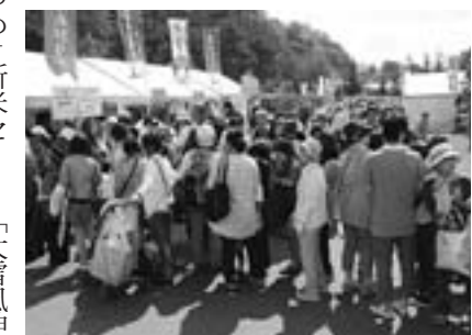
新米の「粟のゆめ」セット限定販売に長蛇の列が出来ました

9月6、7の両日、キトウシ森林公園で第57回くらし楽しくフエスティバルが開かれました。