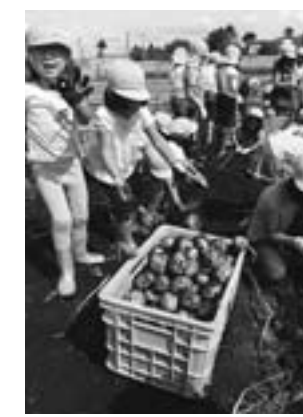
お昼の給食にカレイライスをいっぱい作って収穫祭を開き「おいしかったよ!」。

約100坪(約330平方尺)の畑に、トウモロコシ、カボチャ、ナガネギ、ニンジン、ヒマワリ、じゃが芋を植え、この日は今年最後の収穫日。5歳児約60人の子どもたちが土の中からたくさん育った芋を掘り出しました。