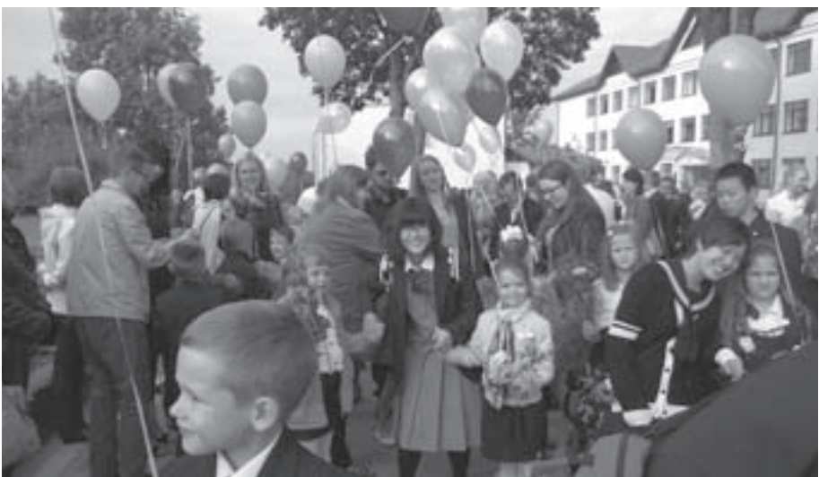
ルイーエナ町に派遣した東川の高校生を案内しました (9月1日、ルイーエナ高校で)