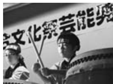
一 小太鼓の熱演 (昨年11月、町民総合文化祭で)