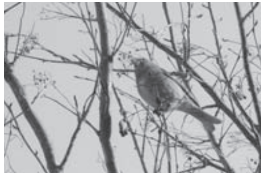
幼児センターのナナカマドの实をついばむキンザンマシコ（昨年1月）

Nature Column (ネーチャーコラム) 自然ガイドなどで活躍する人々をリレーしています。