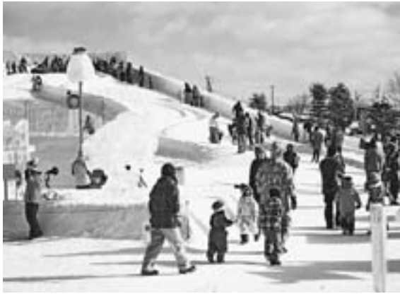
青空に誘われて家族連れいっぱいのにぎわい

ひがしかわ観光協会など実行委員会主催の第41回ひがしかわ氷まつりが冬の祭典の道内トップを切つて開かれ、日曜日は穏やかに晴れ上がり、子ども連れの家族が真冬の冬を楽しみました。