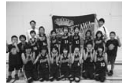
旭川地区2位で全道大会出場した東川ミニ バスケットボール少年団

▼決勝トーナメント 東川ミニバスケットボール少年団 33 -55 札幌前田中央ミニバスケット ボール少年団 ※全道予選ブロック優勝、8位入賞