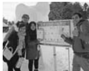
初めての雪像づくりで「ミッキーマウス」像が最優秀賞を獲得して大喜び(日本語留学生チーム)

ゴムボートに乗って雪中を駆け回るスノーラフティングもスリル満点のおもしろさで大人気。