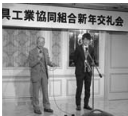
旭川家具工業協同組合の新年交礼会にて

1月、旭川市内のホテルで開いた旭川家具工業協同組合(43社、桑原義彦理事長)の新年交礼会で加盟各社の社長から祝福も受け「去年は最高の年だった。今年はさらに大きな目標に向けて結果を残したい」。