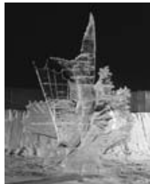
氷彫刻東川コンクールグランプリの「波に舞う」

り気分を味わう家族連れの姿でにぎわい、子どもたちの歓声が会場に響きました。スノーモービルが引つ張る