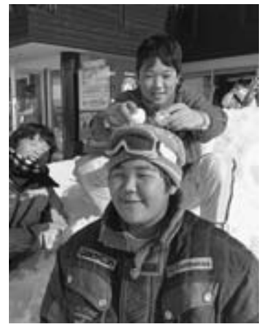
キャンモアスキービレッジで (昨年2月)