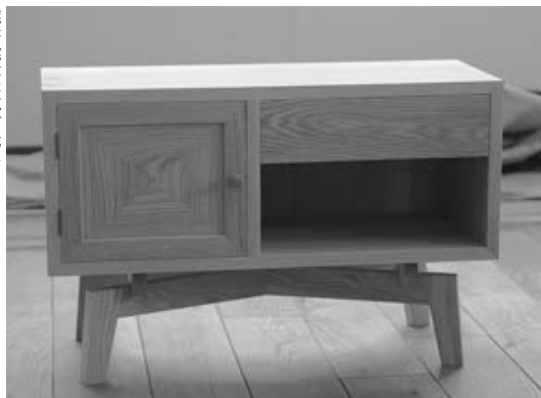
金賞を受賞したキャビネット

次に控えるは世界大会。「半年前に各国代表に教えるエキスパートに課題が発表になるので、練習期間は4カ月間。2カ月前にはしっかりとできるようなってなければいけません。まだ大会への実感はないし焦りもない。楽しみです」。