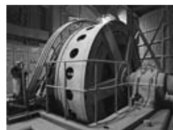
セメント粉砕機駆動部 Drive of cement grinding mill 2010年