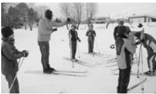
東川スキー少年団の放課後練習(2月16日、羽衣公園)

町民のだれもが生涯を通じて、いつでも、気軽にスポーツに親しみ、楽しめる「生涯スポーツ社会」の実現ができるような環境づくりを積極的に