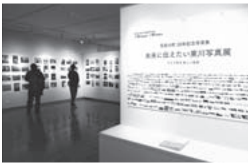
文化ギャラリーで開いた写真展

昨年の写真文化首都宣言を記念して、町では写真の町30周年記念写真集「未来に伝えたい東川」(変形A4版、非売品146ページカラー)を編集、発行しました。併せて3月28日から4月16日まで、文化ギャラリーで同名写真展を開きました。写真集は5月、町内全戸に無料配布します。