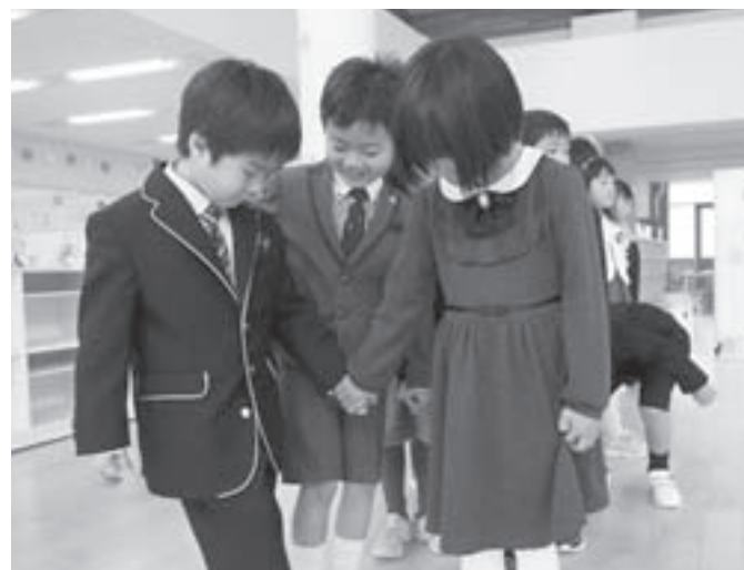
ネクタイ姿とワンピースで仲良くおしゃれに決めて(東川小で)