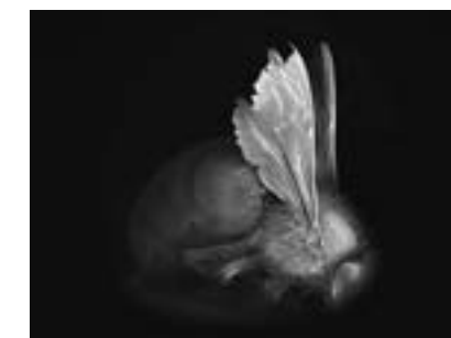
Dead Bee Portrait #3 2014 From the series, No Vertical Song - The Dead Bee Portraits