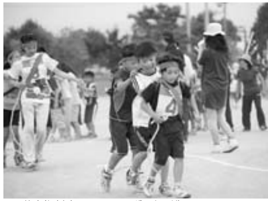
町民体育祭(昨年7月6日、町民グラウンド)