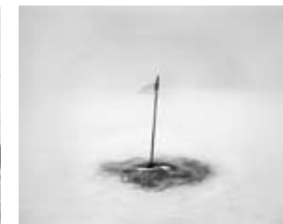
PISS POLE #1 ANTARCTICA 2008