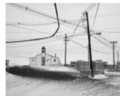
Chapel of the Snows, McMurdo Station, Ross Island, Antarctica 2008 From the series, The Last Road