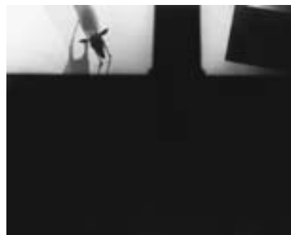
みることについての展開図 04 A certain composition of eyes 04 2014年