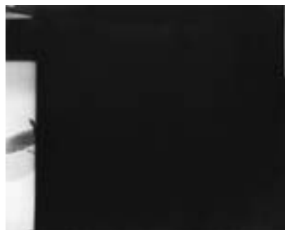
みることについての展開図 02 A certain composition of eyes 02 2014年