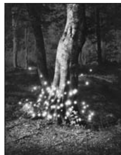
Shirakami #7 2008