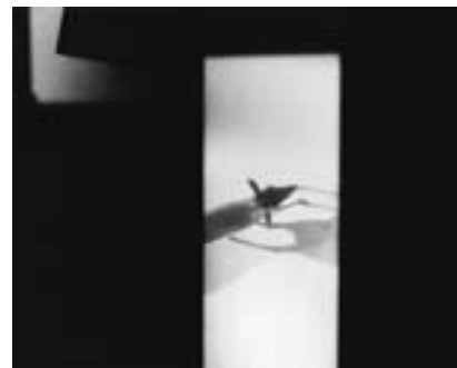
みることについての展開図 05 A certain composition of eyes 05 2014年