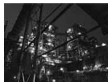
夜のプレヒーター Overall view of preheater at night 2010年