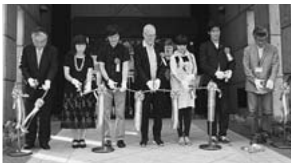
30年目の節目迎えた写真の町東川賞の受賞者作品展テープカット(昨年8月9日、文化ギャラリー)

地方創生が大きな課題となつていますが、本町においては今までも人口減少の歯止めを止め、町の活性化に取り組みんできております。今後とも定住人口と交流人口の総和の拡大に取り組み、文化を生かした新たな町づくりへ向かって目標を定め第一歩を踏み出します。