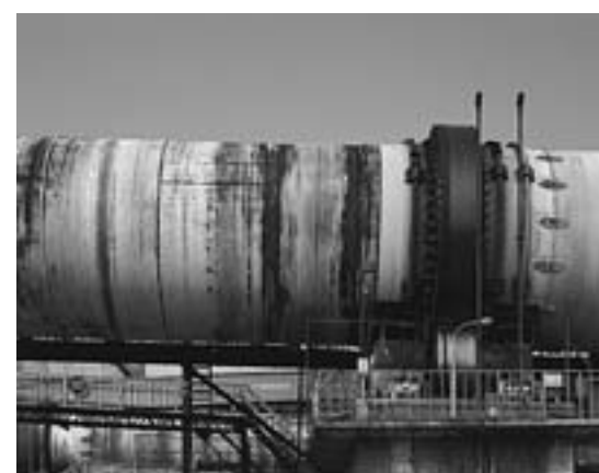
焼成炉 Rotary kiln 2010年