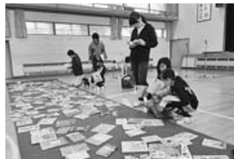
第三小で図書祭り(昨年9月11日)

未来塾」の実施 「授業に付いていけない子」を絶対につくらないという信念の下、学習が遅れがちな生徒を対象に、大学生、教員OBなど、地域ボランティアの協力を得て学習支援をする「地域未来塾」を開設します。