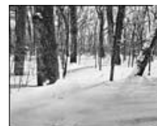
Nikko #2 2001