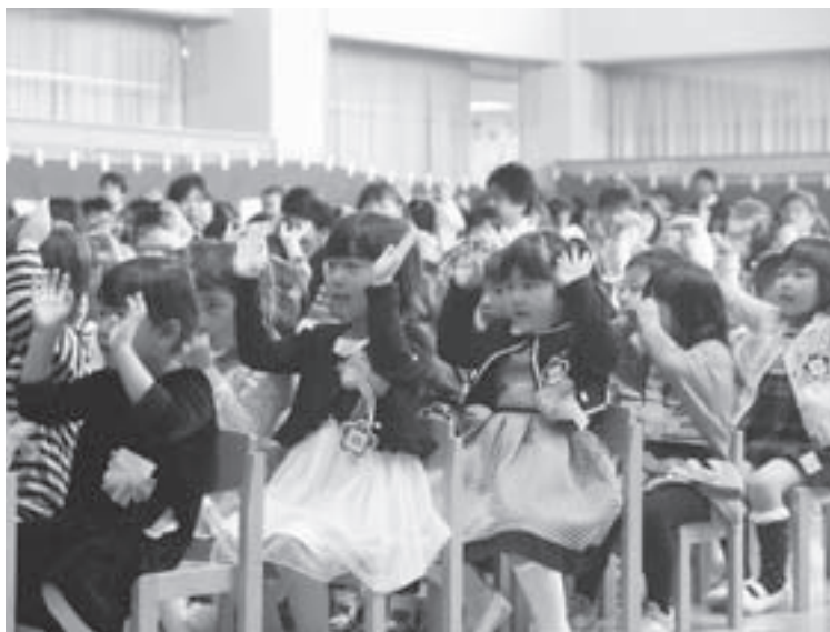
お友だちがいっぱい〜うれしい入園式(幼児センター)

4月、町内の小、中学校で新入学のスタートを迎えました。幼児センターは昨年に比べて13人多い56人の新しいお友だちが入園しました。町内の小学校は4校合わせて昨年より5人多い68人、中学校は昨年に比べて2人多い78人が入学しました。