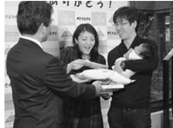
町民8千人目おめでとう(昨年11月6日、役場町民ロビーで)

第1 消費循環型経済の推進 今年も引き続き、ひがしかわ株主や出会った方々とのご縁(エン)を大切に、お互いに応援(エン)しながら、まるく円(エン)が回る経済対策を共益の視点で実施し、経済の活性化を目指します。