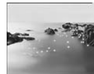
#389 Kamaiso 1999