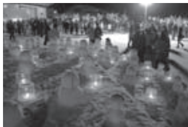
日本語留学生らが150基の雪だるまを制作(16日前夜祭)

期間中同時開催のウィンターコンサートは、東川高校吹奏楽同好会が初出演。8人編成ながら歌謡曲ナンバーなど親しみやすい曲の演奏に拍手が沸きました。