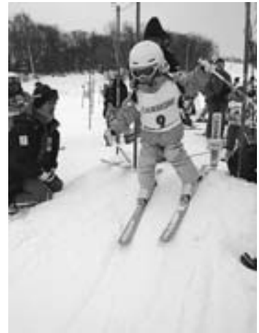
トップ目指して (昨年2月11日、キャンモアGSL大会 =キトウシ・キャンモアスキービレッジ)