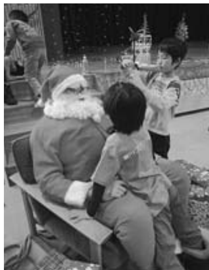
「ホーッ、ホーッ、ホーッ」とサンタクロースで登場(昨年12月12日、農村環境改善センターで開いためだかクラブのクリスマスで)