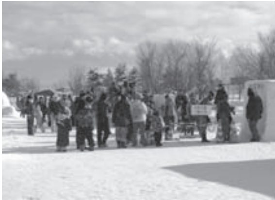
ゲームコーナーはちびっ子で大にぎわい(1月17日)

道内の冬のイベントを切っ掛けにひがしかわ氷まつりが1月16日から18日まで3日間、羽衣公園をメイン会場に開かれました。この冬最高のしばれと好天に恵まれ、雪と氷と光のアートは絶好のコンディション。休日の会場に親子連れのにぎやかな歓声が響きました。