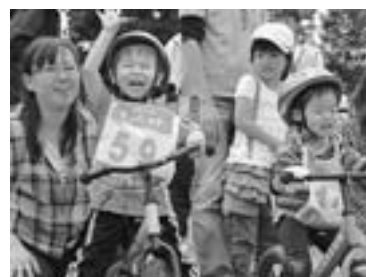
「キッズバイクinひがしかわ」大会で (昨年6月29日、キトウシ森林公園)