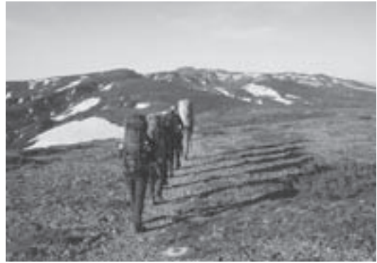
トムラウシ山へ向けて高根が原を行く

Nature Column (ネーチャーコラム) 自然ガイドなどで活躍する人々をリレーしています。