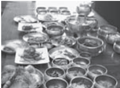
真鍮(しんちゆう)製の器

昔お食事をすると、食べ物をできるだけ温かく保つために金属のお椀が使われました。食器は熱くて重いので、お膳においたまま食べるようになったのです。そして王様や両班(ヤンバン)といわれる貴族の食事は、毒見のために銀のさじやお箸を使いました。金や銀、銅器の食器は高価なもので