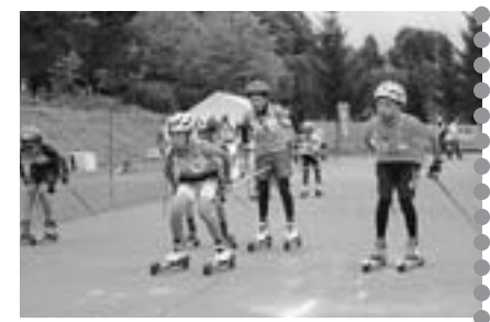
小学生の部スタート(オープン競技)

部、実業団からはJRス キー部の選手も。東川ク ロスカントリースキー少 年団9人もオープン出場 して腕試ししました。 この日は天候もよく、 シーズン入り前の調整大 会として絶好のコンディ