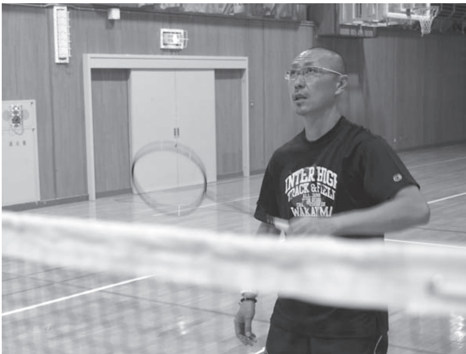
東川高校ではバドミントン部を指導しています