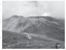
ガスに包まれる熊ヶ岳、間宮岳 (今年9月撮影)

登山は野生生物のすみかにお邪魔するという。普段の生活で「当たり前」にできることができなくなるのは「当たり前」。山での「当たり前」をよく理解して準備をしっかりとすればこそ、雄大な大自然を心ゆくままに楽しむことができます。