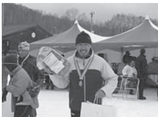
40歳以上5 + の部で2連覇の優勝(昨年3月、旭川パーサー・ロバット大会)

◇ 高校でようやく部活動としてスキーの本格指導を受け、「競技を続けたい」と中京大学へ。だからこそ