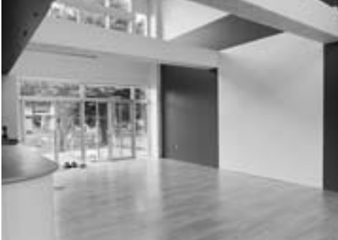
正面入り口すぐのカフェテリア。内庭につながる木製デッキも設置して開放感たっぷり(左側にカウンター、厨房)

昨年から再利用が 始まっていた旧東川 小学校校舎の内部全 面改修工事が9月末 日で完了し、10月15 日「東川町文化芸術 交流センター」とし て新装オープンしま す。多様な文化情報 を発信できる多機能 文化拠点施設に大変 身。