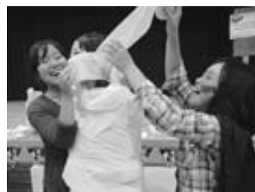
めだかクラブのハロウィンパーティー (昨年10月11日、農村環境改善センター)