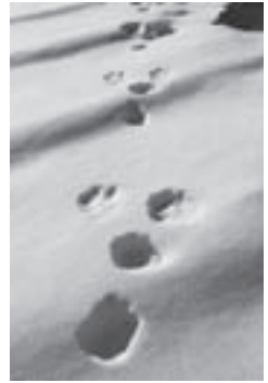
雪上に残っていたエゾユキウサギの足跡（2015年3月、旭岳）

雪というのはスキーやスノーボードで滑走する以外にも多くの楽しさを与えてくれるものだと思います。1年のうち半年近くも雪がある北海道では雪という資源として観光や生活に活用していくことが重要なのではないだろうかと思っています。