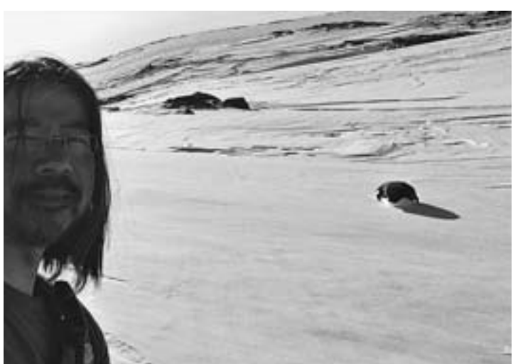
無警戒に、目の前で突然腹ばいになってしまったアデリーペンギンと一緒に (2015年11月8日、昭和基地の太陽光発電施設近くで)

越冬後半の11月初め、昭和基地に1羽の小さなアデリーペンギンが迷い込んで来ました。岩陰から現れた彼に「やあ、ペンギン君。初めまして」と手を挙げながら声をかけました。その時、ちょうど頭を下げたのです。まるでお辞儀をしているようです。思わず「アハハッ」と笑うと、彼は首をすくめてくちばしを開き、「アアア」と声を発しました。その仕草は足元の段差を見るためだったのです。彼はしばらく笑い続ける私を見ていました。首をか