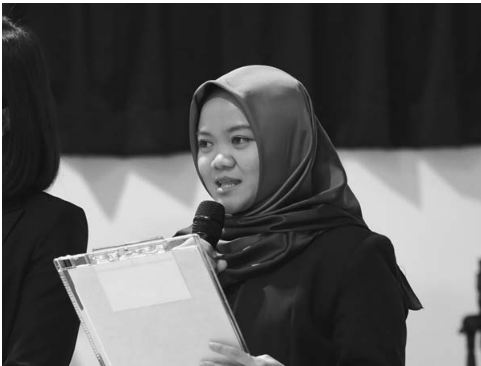
初開催の東川町国際文化フォーラムで司会を担当しました(1月20日)