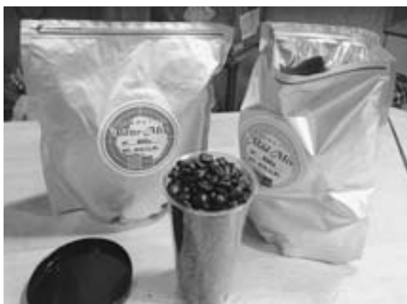
札幌のコーヒー焙煎店オリジナルの「南極ミックス」(左がピターミックス、右が開封したマイルドミックス (2015年7月13日))

夕食後、その日の作業度合と翌日の作業段取りを話し合う全体ミーティングが終了した後は、朝まで隊員たちの自由時間です。管理棟には映画や音楽鑑