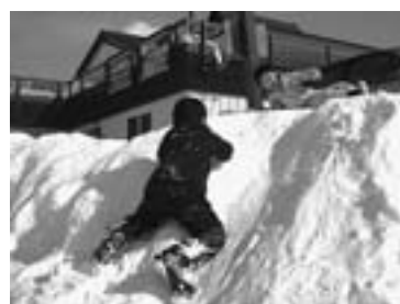
雪山は絶好の遊び場 (昨年2月、キトウシ森林公園キャンモア スキービレッジで)