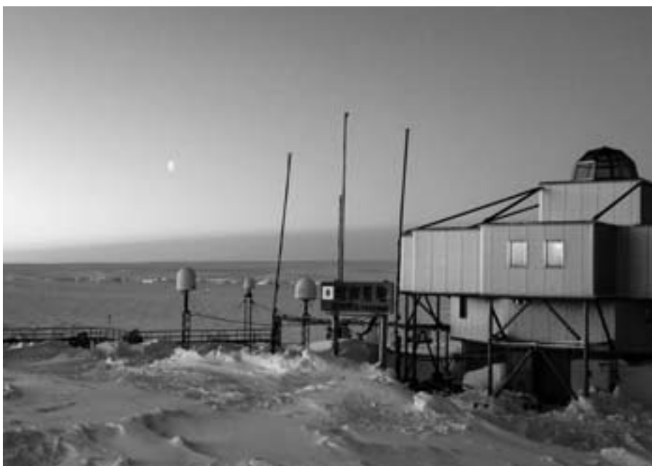
薄明の中に浮かび上がる昭和基地の管理棟 (2015年6月23日)

(前月号から続き) 私が勤務している旭川医科大学には大規模な通信用ビデオ会議システムがあります。極寒の地で生じやすい病気とけがについて専門的知識、治療経験を持つている医師も多いので、ビデオ会議を通してその知見を生かすことが出来、頼りがいがありました。 南極での越冬中は、国際協定に基づく緊急搬送用航空機さえ飛べなくなるほどの悪天候が何週間も続く時があります。そうなるとう外界とのやりとりは衛星通信以外、すべて閉ざされます。緊急脱出も不可能です。そのため何らかの医療措置が必要な場合に備えて日本国内の病院と定期的に交信し、医師に遠隔医療相談を持ちかけているのです。 ある日、外の作業をしていて何気なく上を見上げた