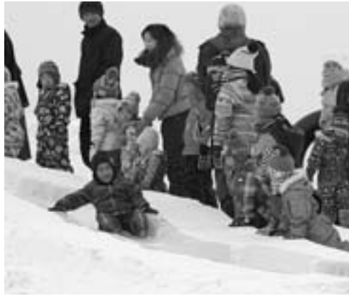
大人気！レインボースロープは長蛇のにぎわい(1月21日)

冬の祭典、ひがしかわ氷まつりが1月21日から3日間、羽衣公園会場で開催され、家族の歓声でにぎわいました。初開催した国際文化フォーラムに参加の5カ国地域からのゲストも来場して厳冬のまつりを楽しみました。