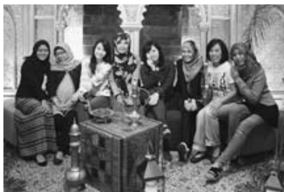
フカシ市の日系企業で働いていた時の通訳メンバーと一緒に(2014年5月)

「大きな会議の通訳では、意味が分からなくても誰かに聞くことができなかったので準備をいっぱいしました。特に本社の通訳の時はプレッシャーが高かった。重役の設問の答えが分からないと大きな障害になるので、直訳ではなく、意図を理解して通訳する必要があります。最初は大変だったけれど、だ