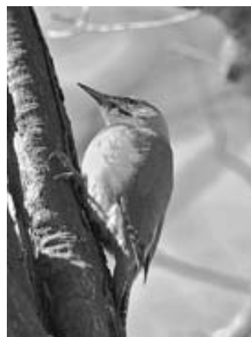
早春のヤマゲラ (昨年3月26日、キトウシ森林公園)