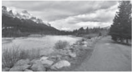
「東川フレンドシップトレイル」と名前がついている散策路

Nature Column (ネーチャーコラム) 自然ガイドなどで活躍する人々をリレーしています。