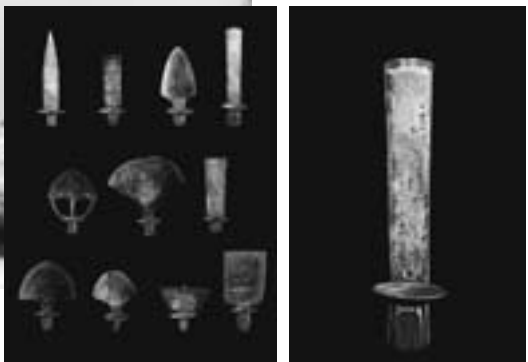
西山さんの未発表作品を撮影したもの

強い個性の写真家に引かれ、硬派 な撮影スタイルだった時期も。ア ルバイトの日々の中で友達の写真 を撮るのはいつも夜。必然的に高 感度で粒子 感の荒い写 真だったそ うです。 広告制作 会社へ入社 したのは、 たまたま欠 員が出たか ら。