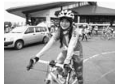
サイクリングシーズン到来 (昨年8月、キトウシ森林公園)