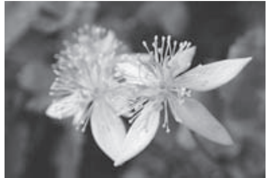
白く華麗な花を咲かせるミツバオウレン（昨年6月、旭岳温泉探勝路付近で）

Nature Column (ネーチャーコラム) 自然ガイドなどで活躍する人達をリレーしています。