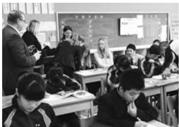
カンガサラ市長(左)らが東川中の授業を参観(5月22日)