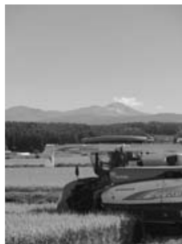
豊作の秋 (昨年9月17日、株主ファームの稲刈り)