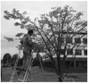
大きく成長して生い茂った枝葉が敷設電線まで届くほど伸びていた。写真