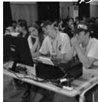
▲作品セレクト会議(手前はキャンモア高校チーム)=7月31日、文化芸術交流センターで=