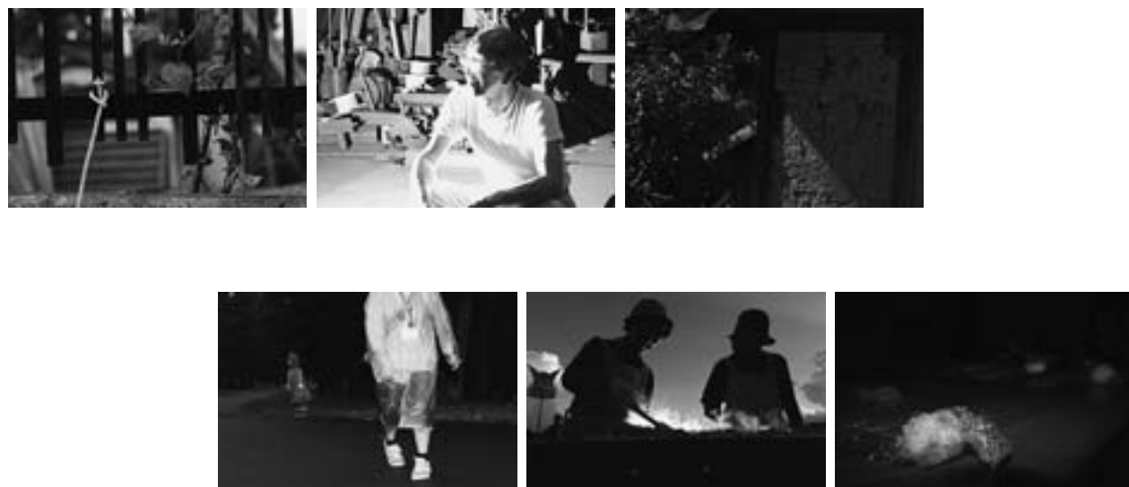
写真インディペンデンス展/合評の集い(7月30日、文化ギャラリー)