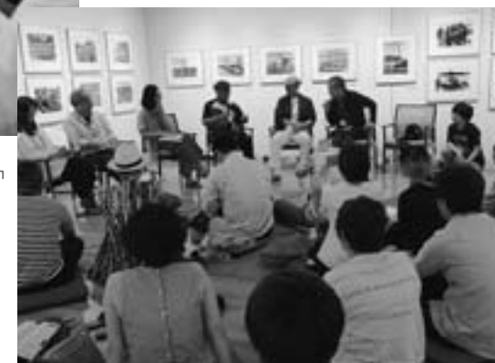
写真の町東川賞受賞作家フォーラム(7月30日、文化ギャラリー)

「Photo Square」で個展開催権を獲得しました。副賞としてデジタル一眼レフなども贈呈しました。赤れんが公開ポートフォリオオーディション2017は、一次審査に挑んだ20人がそれぞれ作品集を持ち寄ってエントリーし、ポートフォリオの審査を行いました。最終審査には6人が残