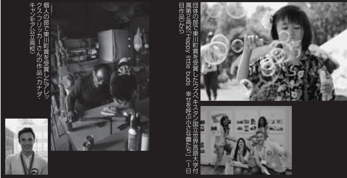
団体の部で東川町賞を受賞したウズベキスタン国立世界言語大学付属第2高校 Happy little buds 幸せを呼ぶ小さな蕾たち(1日制作)から