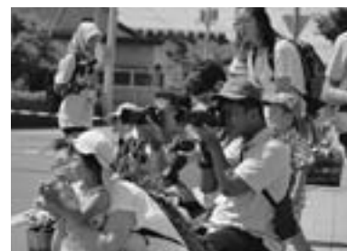
▲大道芸パフォーマンスにシャッターチャンス=インドネシア・カルティニ1高校チーム(7月30日、東町1丁目会場)=