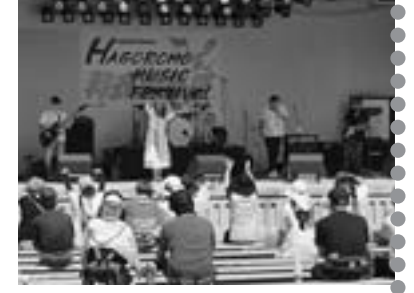
「飛呼露天(とこころてスターラーメンズ)」(旭川) 〓写真〓など旭川の4バンド。懐かしの80年代サウンドを熱演して応援席からも拍手喝采。地元・東川からは今年も

8月20日、東川イベントサポートクラブ主催の第21回羽衣音楽祭が羽衣公園で開かれました。回を重ねて今やアマチュアバンド野外コンサートの一の殿堂ステージ。今年も12バンドが出場しました。初出場は4年前に結成したという「ベビ