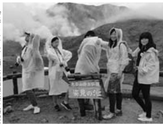
「どお?イケてる」(国立台湾師範大学付属高校 チーム、7月31日旭岳参見)