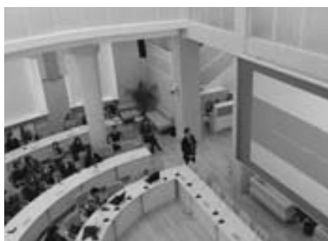
大平洋大学での講義風景(2016年、ロシア・ハバロフスク市)

出会ってわずか1週間。ハンさんは契約満了で帰国することに。その後二人は携帯電話で連絡を取り合っていました。「自動