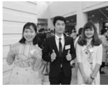
ベトナム人参加者の新成人3人

対象は昨年より1人少ない125人。69人が出席しました。海外からは、昨年から農業研修に來ているベトナム人農業研修生、旭川福祉専門学校で日本語を学んでいるベトナム、マレーシアからの留学生合わせて4人も参加しました。