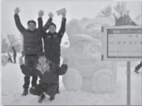
雪像コンクール初優勝した旭川ケーブルテレビ株の「ポテラと香香(シャンシャン)」

前夜祭の午前8時、氷点下11.4度まで下がりましたが、例年に比べて冷え込みは厳しくなく、日中好天で祭り日和の出だし。東川のほかに札幌、旭川、北見、帯広、深川から7人が出場し、「鯉舞踊」コイダンス」を制作した地元・東