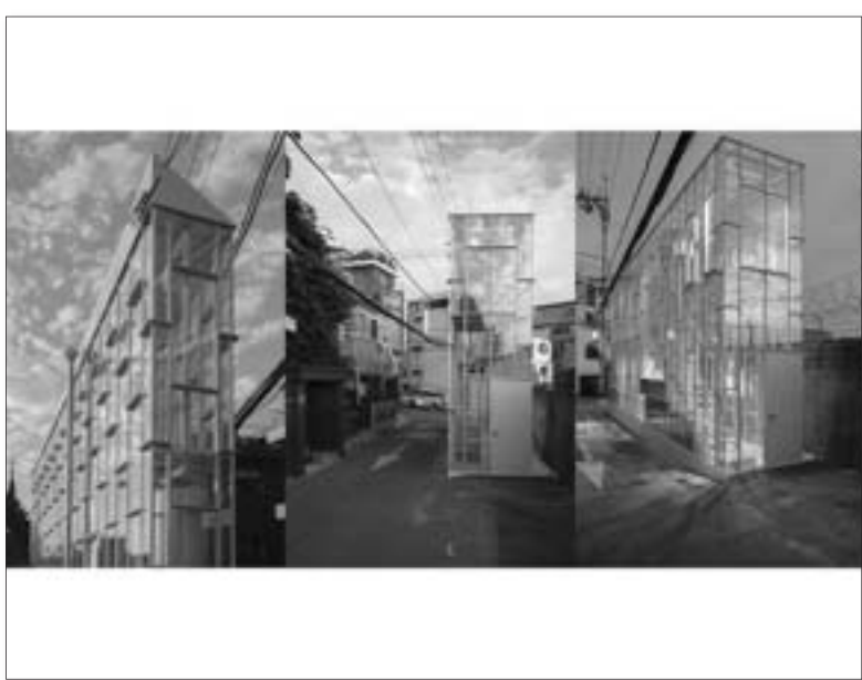
「グラスハウス」と名付けた狭小建築カフェ。幅12m、奥行き細い方面積が1.4坪の全面ガラスの小さなおしゃべり空間をデザインし、2014年の人気店になった。

「その時、考えたんですよ。写真の町なのに、テストプリントできるところはないの？って。作品を作るまちっていうのを産業にしたらいいかなって思いますよ」。