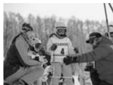
キャンモアGSL大会の朝 (昨年2月11日、キャンモアスキー場)