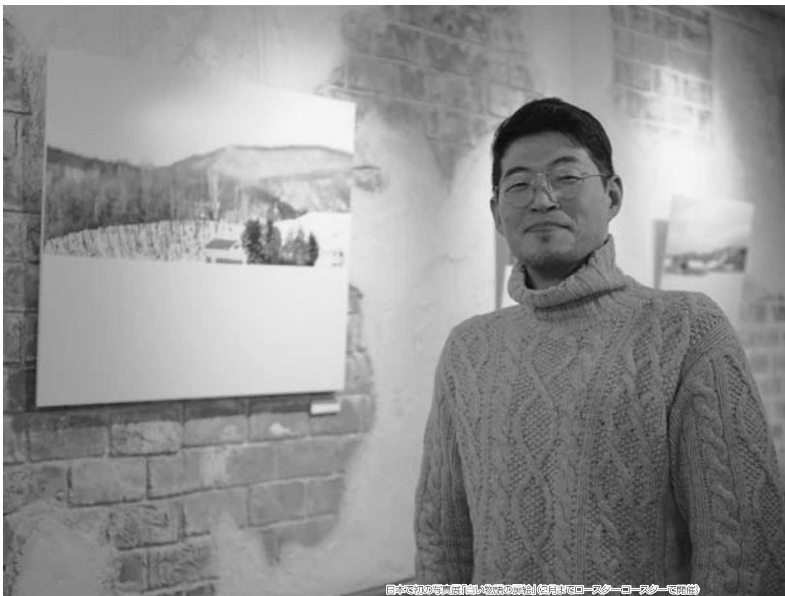
日本で初の写真展「白い物語の扉絵」(2月までロースター・コー・スターで開催)