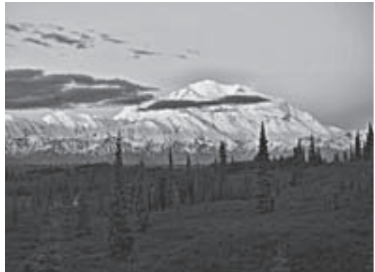
朝焼けに赤く染まるデナリ山（昨年7月3日午前3時57分）

Nature Column (ネーチャーコラム) 自然ガイドなどで活躍する人々をリレーしています。