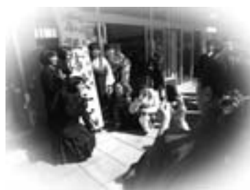
東川小学校卒業式 (昨年3月20日)