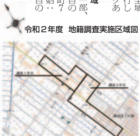
令和2年度 地籍調査実施区域図

現地と図面が合わない土地で境界トラブルが発生すると、係争地の周辺を含む広い区域を測量し直して調整しなければなりません。その場合測量経費が高額になるため、個人では土地境界を確定または解決できない事態になりかねません。国土調査法に基づき土地の位置や面積などを事前に把握することで、土地境界に関するトラブルを未然に防ぐことができます。