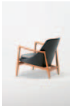
イブ・コフォド＝ラーセン「エリザベスチェア」