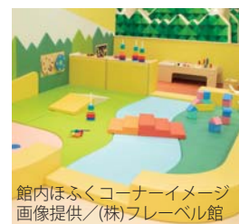
館内ほふくコーナーイメージ