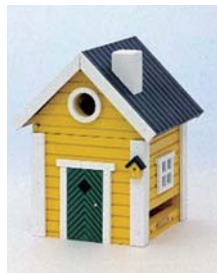
▲織田コレクションより

人と自然との調和のシンボルである「バードハウス」のデザインコンテストを行います。一般の部の部(今年から新設)子ども部(中学生以下)に自作のバードハウスを応募してください。中から、それぞれ特賞・参加賞を授与します。