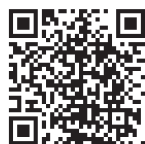
▲新たな防災気象情報について