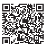
▲インターネット受付

第1次試験 5月24日（日） 第2次試験 7月7日（火）～同10日（金の指定された日） 問合せ 北海道労働局総務部総務課人事第一係 ☎011-709-2311