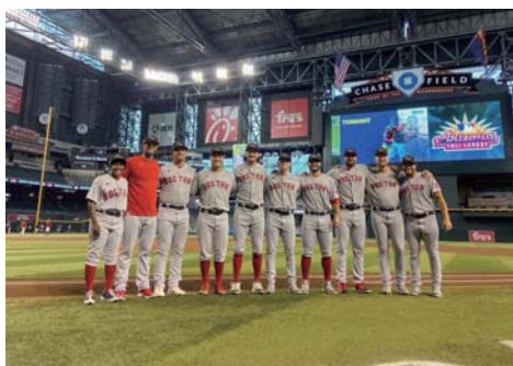
▲アリゾナフォールリーグにて

野球は公式戦以外でも、世界のどこかで年中試合があります。2022年に私はアリゾナフォールリーグの指導に行きました。メジャー30球団からマイナーリーグのトップ選手を集めた6週間の育成リーグです。私が担当したスコッツデール・スコーピオンというチームには、レッドソックスやエンゼルスなどの所属選手が来ていて、何人かは現在もメジャーリーグでプレーしています。このリーグはメジャーリーグさながらに、オールスター戦やホームラン競争も行われ、観客は未