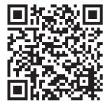
大雪清掃組合 ホームページ

〒071-0226 美瑛町字下 宇莫別第5 大雪清掃組合 ☎ 92-2247 FAX 92-1666 Email: seisou@town.dai.hokkaido.jp