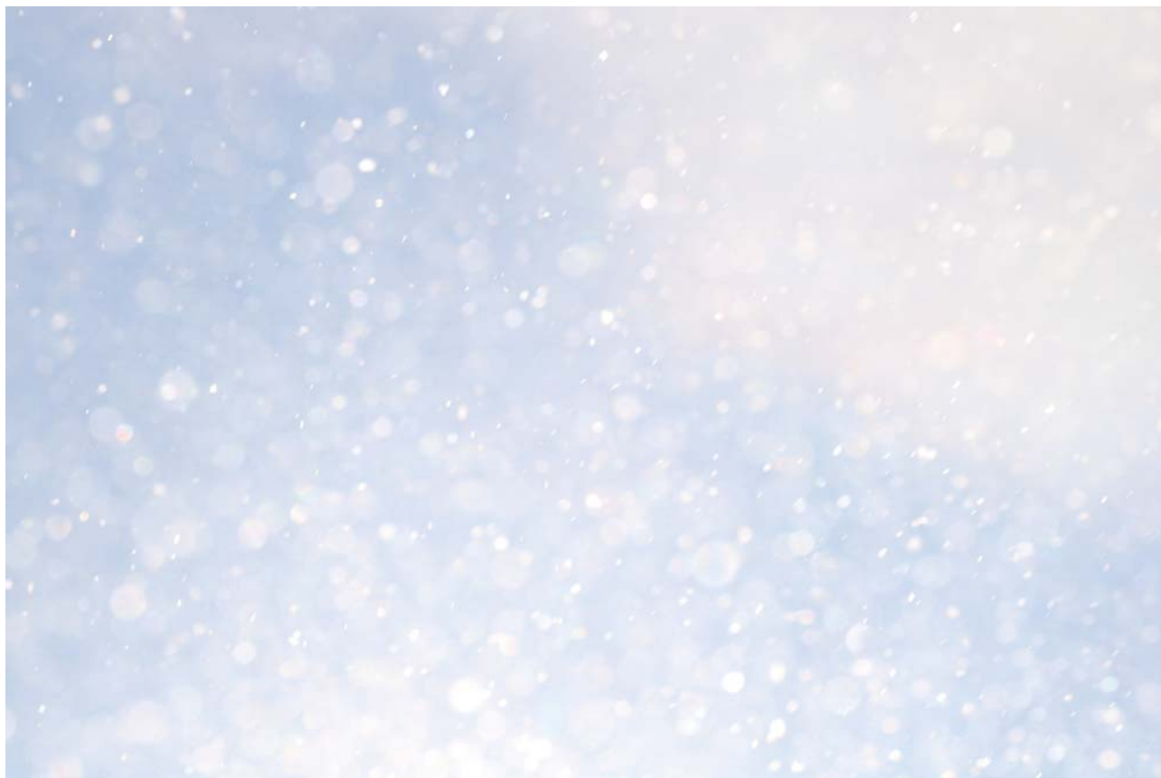
第20回ひがしかわ大写真展 子ども部門風景コース準グランプリ『冬』 杉野晁慈朗