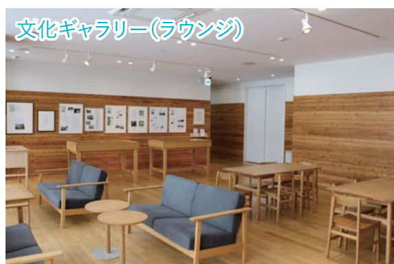
文化ギャラリー(ラウンジ)