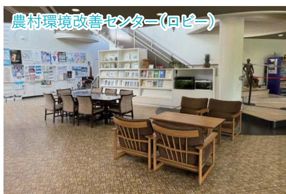
農村環境改善センター(ロビー)