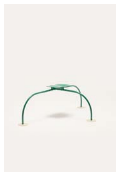
アキッレ&ピエール・ジャコモ・カスティリオーニ 「アルナッジョ」