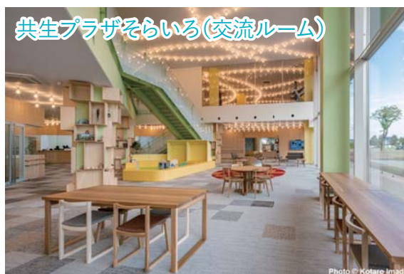
共生プラザそらいる(交流ルーム)