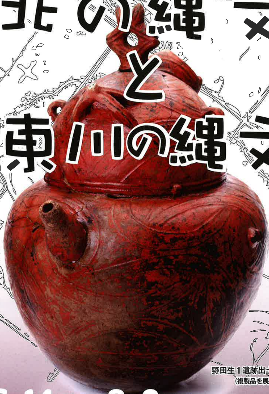
野田生1遺跡出土赤彩注口土器 (複製品を展示します)