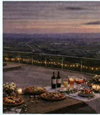
景色と音楽、そしておいしい料理をご用意しています

きとろんの屋上から、ゆっくりと暮れていく夕日と東川の美しい町並みを眺めながら、町内飲食店によるおいしいフードやドリンクで特別な時間を過ごしましょう。木管五重奏が奏でる美しい音色もお楽しみいただけます。