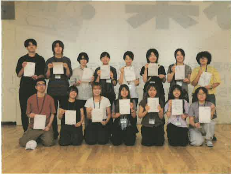
2025年のフォトフェスタふれんず

「フォトふれんず」とは、写真の町東川の受賞作家作品展」の展示運営やフォトフェスタのイベント運営を支えてくれるボランティアアスタツフです。写真や地域の文化活動に関心を持つ人たちが集まり、交流を楽しみながら会場づくりを担ってくれます。 「フォトふれんず」の活動は1985年の写真の町の始まりとほぼ同時期にスタートしました。写真を志す二十歳前後の学生を中心に展示運営やイベント運営を通して、実践的な経験を積んでいます。東京・大阪など全国各地から15名前後の方が参加していただきます。