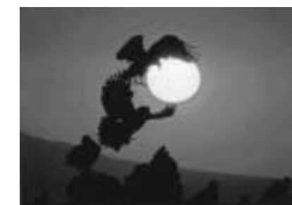
「クナシリの朝日に舞うオジロフシ」 二宮洋二写真展より