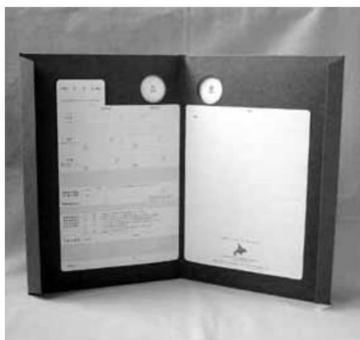
二人に贈られる記念婚姻届

皆さんは結婚について、どのようなイメージや記憶を持っていますか？ 派手な結婚式？、感動した結婚式？、ふたりだけの地味婚？…では、結婚した瞬間は？