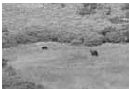
親子グマ@御田ノ原 ロープウェイ姿見駅から、肉眼でも動きが確認できました。

高山植物、紅葉、雪、動物など「自然の大博物館」と言われる大雪山の素顔が見えてくることでしょう。