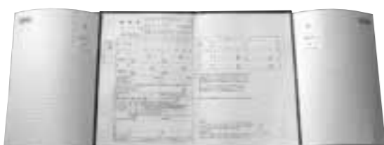
複写式になった新しい婚姻届