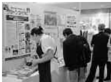
八重洲地下街観光キャンペーン