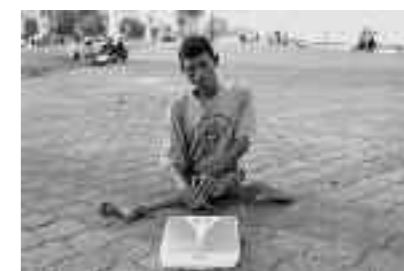
「体重測定屋で小銭を稼ぎ、その日を生き延びる身体障害者の男性」