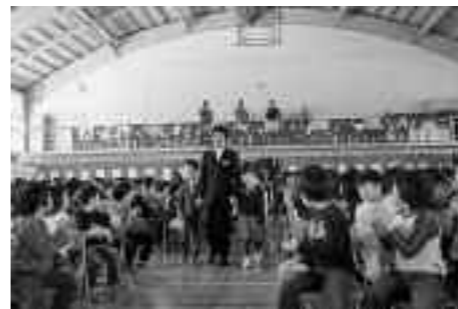
“ワクワク・ドキドキ”の入場