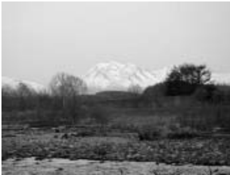
忠別川とオプタテシケ山

高山植物、紅葉、雪、動物など「自然の大博物館」と言われる大雪山の素顔が見えてくることでしょう。