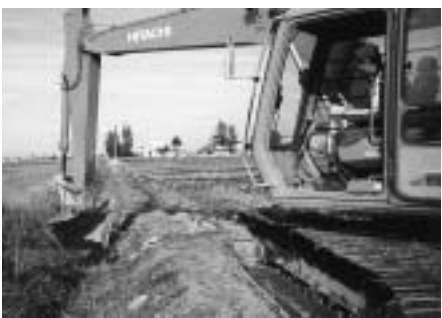
排水路整備の様子

（役場産業振興課農務係内 ☎82-2111内線135）までお問い合わせください。