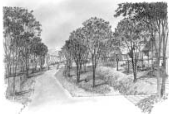
グリーンヴィレッジ（南町4丁目）構想図

東川町は、写真の町づくりや商店街の木彫看板設置、農家地区の芝桜の植栽、花俱樂部などによる花植栽など美しい東川の風景を守り育てる地域づくりが認められ、平成17年3月に都市計画を持たない町としては全国で初めて景観法に基づく景観行政団体になり、景観計画を策定することになりました。 既に美しい東川の風景を守り育てる基本計画があることから、その内容を基本に、未来の東川町が美しく輝く町になることを目指した景観計画にしたいと考えております。 今年中を目標に計画策定に向けて専門化の意見を聴きながら作業を進めており、素案の一部は次のとおりです。