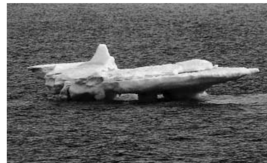
フォトきらめき写真展より 村瀬正三さんの作品