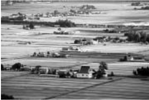
キトウシ山からの田園風景

東川町は、写真の町づくりや商店街の木彫看板設置、農家地区の芝桜の植栽、花俱樂部などによる花植栽など美しい東川の風景を守り育てる地域づくりが認められ、平成17年3月に都市計画を持たない町としては全国で初めて景観法に基づく景観行政団体になり、景観計画を策定することになりました。 既に美しい東川の風景を守り育てる基本計画があることから、その内容を基本に、未来の東川町が美しく輝く町になることを目指した景観計画にしたいと考えております。 今年中を目標に計画策定に向けて専門化の意見を聴きながら作業を進めており、素案の一部は次のとおりです。