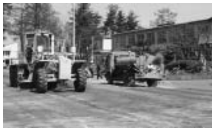
キレイになったグラウンドを見て来て