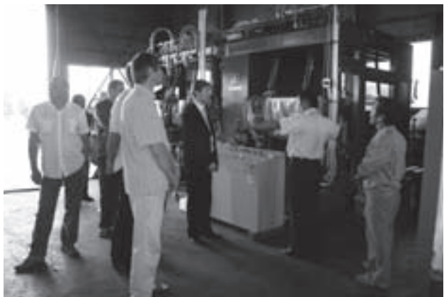
▲これからロシアに輸出するという木材皮むき機に興味深げ=エノ産業で（第4日）