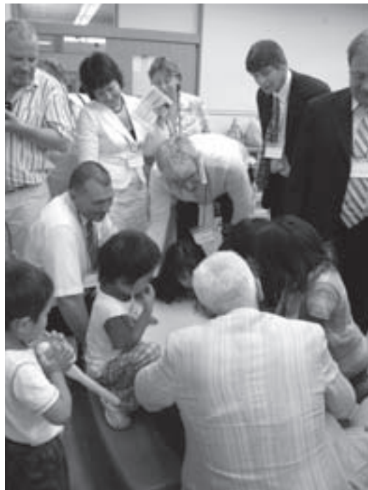
▶幼児センターでは子供たちから大歓迎（第2日）

4泊5日という短い滞在期間中、ルーイエナ町訪問団は町内各所を訪れました。旭川市内の回転寿司店では、ハマチの鮮魚解体ショーに思わずカメラのフラッシュ。宿泊した旭岳温泉のホテルでは、初めて温泉に入浴して感激したようです。東川高校学校祭の前夜祭ねぶた行列に飛び入り参加し、東川小スクールバンド、東川中吹奏楽部との合同演奏では見事な演奏を披露しました。その短い滞在記録を写真で紹介します。