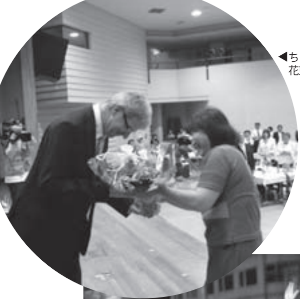
◀ちょうど誕生日だったヴァイヴァルス大使に花束贈呈（第2日、歓迎パーティーで）