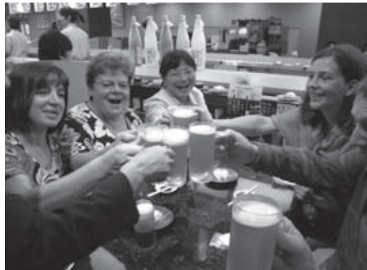
▲初日の夕食は旭川市内の回転寿司店（第1日）