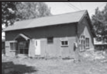
農家の納屋を改造した工房