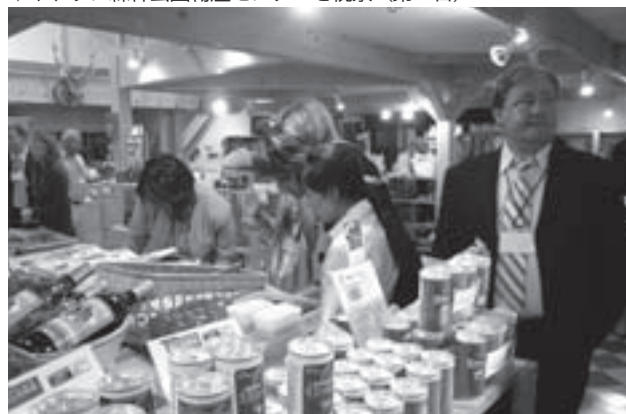
▼キトウシ森林公園物産センターを視察（第2日）