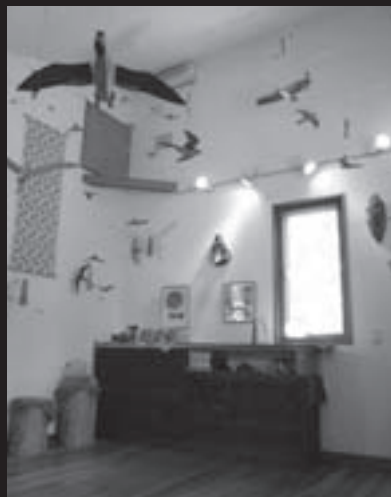
ギャラリー内はさまざまな種類の鳥が飛んでいます