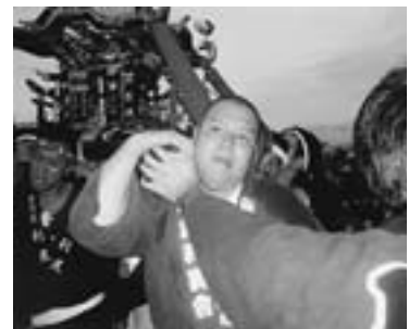
第2回東川大写真展入選作品から 「祭りだ! セイヤァー」