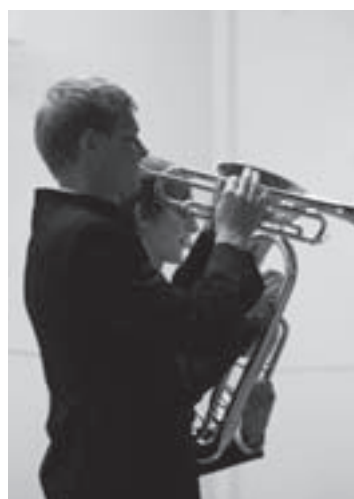
▲東川中で開いた合同演奏会（第4日）