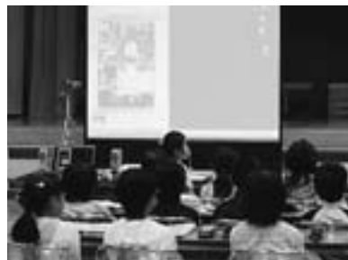
大画面のプロジェクターにキャンモア町の様子が映し出されました

東川のお祭りとして、くらし楽しくフェスティバル、山の祭り、国際写真フェスティバル、写真甲子園、どんとこい祭りなど、代表的な町内行事を一気に紹介。ほかに「毎日学校給食があります」「道の駅・道草館でソフトクリームを売っています。抹茶ソフトがおいしいよ」「旭岳源水があります」と写真も見せて紹介しました。