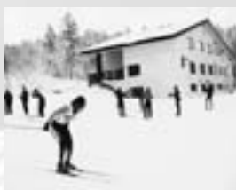
▶大学対抗のクロスカントリースキー記録会

の帰省を迎えるように活気づいているのです。全国から数百人ものノルディックスキー選手が練習のため、それぞれの常宿に「帰ってくるからです。日本初のW杯銅メダルに輝いた夏見円選手をはじめ、一流選手はみな11月、12月の旭岳合宿の経験者でした。明日の日本代表も、きっとこの中にいるでしょう。