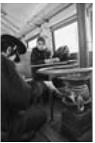
日本旅行写真家協会 写真展から青森県

●10月25日(土)～11月3日(月) ・第38回町民総合文化祭作品展 ※11月4日(火)展示入れ替えのため休館 ●11月5日(水)～11月24日(月) ・「白鳥」福田光写真展 ・第2回青少年ワークショップ写真展 ・東川フォトクラブ写真展 ※11月25日(火)展示入れ替えのため休館 ●11月26日(水) ～12月11日(木) ・日本旅行写真家協会 写真展 日本列島縦断24時間 -Japanese Workers- ・第二小学校親子ふれ あい写真展