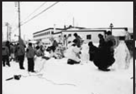
第二小、第三小の氷彫刻作り