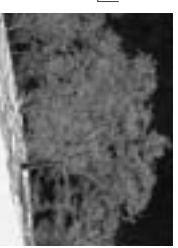
林明輝写真展より

文化ギャラリー展示案内 ●2月18日（水）～3月9日（月） ・林明輝写真真展 ・「大きな自然大雪山／森の瞬間」 ・参加募集> <参加募集> 「ぼくの日記帳は、カメラだった。」 ●1月28日（水）～2月16日（月） ・全日本写真展2008 ●2月3日（火）～2月16日（月） ・スチートキヤッチー・グランプリ展 日時：2月22日（日）13：30～ 場所：文化ギャラリー（参加無料） 飯塚達史写真真展「identity」