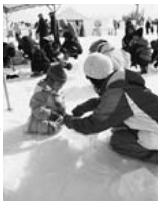
大好評親子でアイスカップ作り

会場では町民ら手作りの雪像19基、日本氷彫刻会旭川支部の氷彫刻コンクール氷像14基が出来栄を競いました。会場に向かう一丁目道路は、道路沿いの雪明りに映える夜のアイスクャンドルに加え、新たにウッドランタンも登場しました。郷土資料館前には、第二小と第三小児童の氷彫刻作品17基の力作も並んで来場者