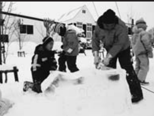
氷まつり児童作品作りの指導

夏は、花火師として道内各地の祭りから「お呼び」がかかります。昨年は7月中旬、函館を振り出しに、8月まで夏祭り最盛期に「網走・函館・東川・北竜・稚内・帯広・豊頃・足寄・釧路」と、寝る間も惜しんで約4千キロメートルを駆け巡りました。