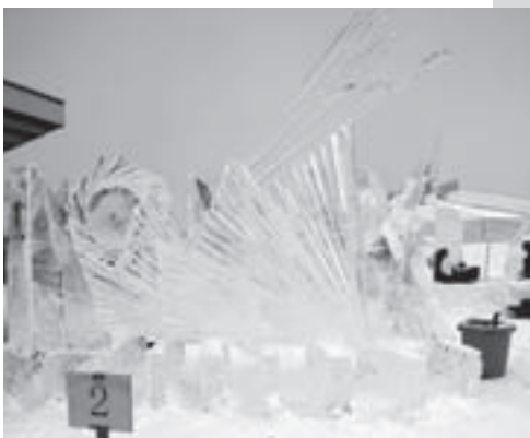
▲氷彫刻コンクール優勝作品「輝」