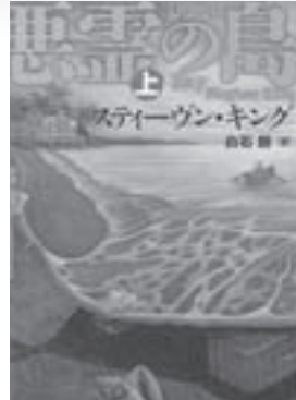
悪霊の島 上・下(一般書) 著/ステイヴン・キング 刊/文藝春秋

「まどっておくれ まどっておくれ(償っておくれ、弁償しておくれ)」。いつだって、そいつが言うのはそればかり。悪いことやいやなことは、全部だれかのせいにして、どんなに親切にされたって、ありがたいなんて思わない。それがそいつさ、「ツエねずみ」。とうとう誰にも相手にされなくなったツエねずみに、ねずみ捕りが話しかけ…。