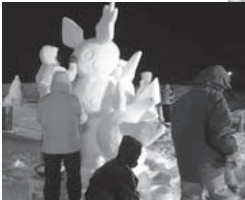
▲製作中の「ポケモン」。雪像コンテスト最優秀賞を獲得しました