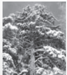
大雪山中にりんごそびえ立つ真冬のアカエゾマツ