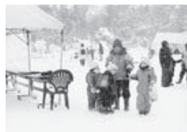
第5回しがしかわ大写真展 町民一般部門 「ばあちゃんといっしょ。～亡き母へ～」