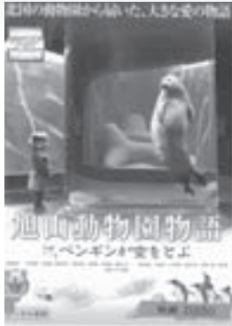
旭山動物園物語(映画、DVD) 角川エンタテインメント

貸し出し期間は、図書は1人5冊まで14日間、ビデオは1人2本まで4日間です。返却期間を守りましょう(夜間返却窓口もご利用ください)。