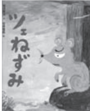
ツエねずみ(絵本) 文/宮沢賢治 絵/石井聖岳 刊/三起商行

旭川市旭山動物園の園長は、財政赤字を抱える動物園を立ち直らせるべく、日々奔走していた。そんな中、人間よりも昆虫が好きな青年・吉田が新人飼育係としてやってくる。情熱あふれる園長、ベテラン飼育係とともに動物園を盛り上げようと努力を続けるが、園内で感染症が発見され、とうとう廃園の危機が迫ってしまう。(112分)