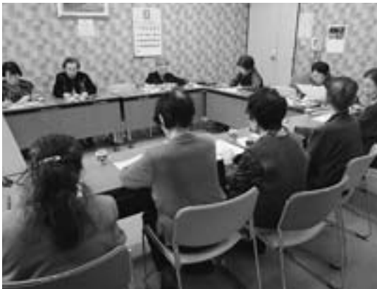
農村環境改善センター青年婦人室

旭川支社加盟の団体（当時）として活動を始めました。 「こまくさ」会員が中心的存在だったため、1960（同35）年、「こまくさ」の名を冠した会員合同句集第一集を発刊。以後ほぼ5年ごとに合同句集を発刊。第五集までは潮音・新懇旭川支社が発行主体となっていました。