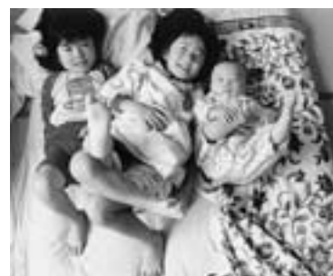
第5回ひがしかわ大写真展 町外一般部門 準グランプリ