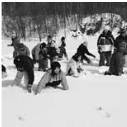
新雪をかき分けて宝探しの参加者

後の昼食は温かい豚汁に舌鼓。冷えた体を温めました。会場では、今年も冬の雪の中でもしつかり根付くという特殊な方法で雪中植樹も行いました。参加者の皆さんは元気な森に育つことを願ってカツラ、オニグルミ、エゾイタヤ、ドロノキ4樹種をセットにして60カ所に植樹しました。