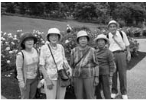
「花を訪ねて」小旅行

60歳以上になってもいつまでも生き生きと健康に暮らすコツは、趣味や生きがいを持つこと。しらかば学級では、皆さんのさまざまな趣味、生きがいをサポートできるように活動を行っています。4月