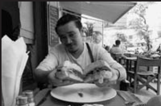
ラオス・ビエンチャン市内のカフェでおいしいフランス風サンドイッチを満喫（2009年1月）