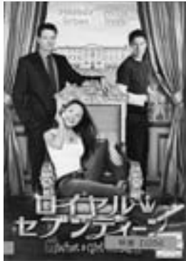
ロイヤルセブンティーン (映画、DVD) ワナー・ホームビデオ

貸し出し期間は、図書は1人5冊まで14日間、ビデオは1人2本まで4日間です。返却期間を守りましょう(夜間返却窓口もご利用ください)。