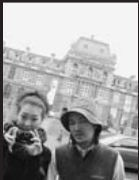
パリ・フォトを見に（2008年11月、パリ・メトロポリタン博物館周辺で）