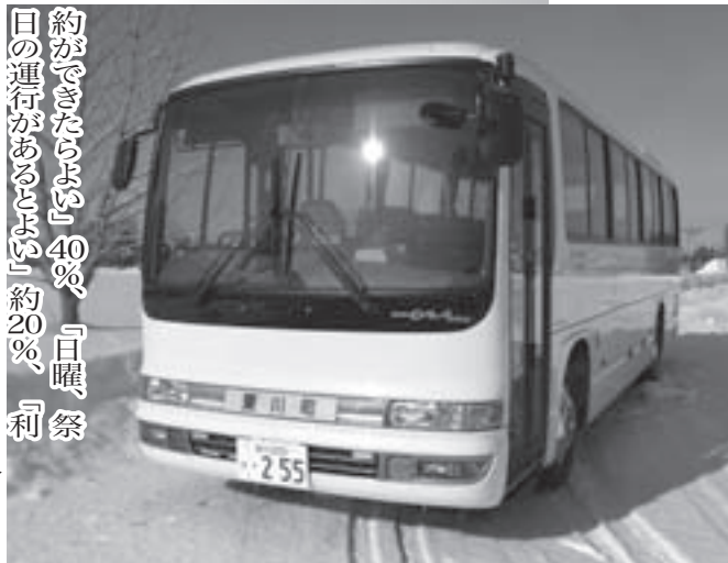
昨年導入した町営バス新型車両▶

「高齢になったら」「(車の)運転・行動に不安を感じたら」という回答もあり、潜在需要は高いようです。乗り合いタクシーに関して「当日予