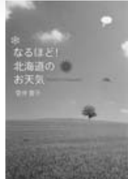
なるほど! 北海道のお天気 (一般書) 著／菅井貴子 刊／北海道新聞社

人形劇のおおかみくんは、いつも「あこちゃん」を泣かせてしまいます。ほんとうは、かっこいい役をしてなかよくなりたいのに、怖くて悪い役ばかり。そんなおおかみくんを子供たちは毛糸で巻き、木の上につるしました。そして悪いおおかみをやっつけようとみんながお手玉を投げるなか、あこちゃんは…。