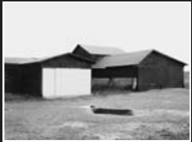
PLACES I, 2009 ©北島敬三 Keizo Kitajima