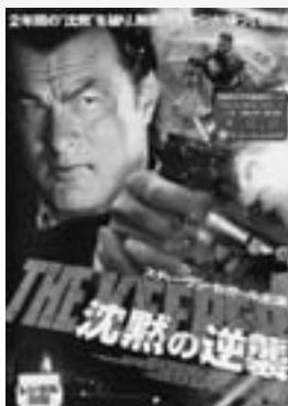
沈黙の逆襲 (映画、DVD) ワーナーホームビデオ

貸し出し期間は、図書は1人5冊まで14日間、ビデオは1人2本まで4日間です。返却期間を守りましょう(夜間返却窓口もご利用ください)。