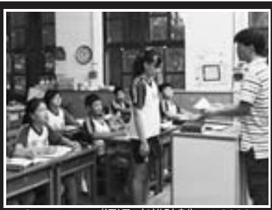
LauSong Project (廻返:老松計画) #6, 2009 ©陳敬寶 Chin-pao Chen

わしい賞金額になりました。今まで「東川賞」として馴染み深かった名称は、今回から新たに「写真の町東川賞」と改称しました。以下、各賞の受賞者講評は東川賞審査会委員、佐藤時啓氏。