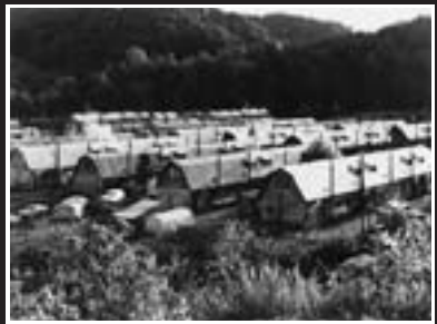
夕張定点観測 千代田地区の炭住街 1983年