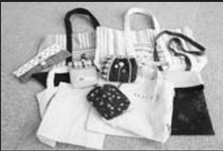
ナチュラルな風合いの手作り商品

コトtonかりネンを使ったナチュラルテイストの手芸小物が中心。帆布を使ったデザインバッグ、麻ひものバッグ、保冷ポトルカバー、ウエストポーチ兼ショルダーポーチ、パインを手作りする時に使う発酵用マット、手作りの洋服…など。もちろんリクエストにも応じます。使いやすいヒントが思い浮かぶと、その場で形に仕上げていきます。その機動性の良さが手作りの良さでもあり、ファンが増える大切な要素でもあります。