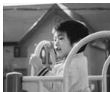
第5回ひがしかわ大写真展 町民子ども部門準グランプリ