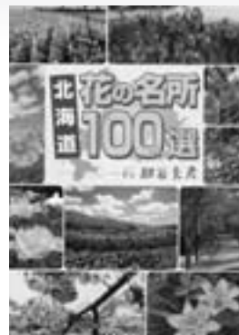
北海道 花の名所100選 (一般書) 紺谷 充彦 / 著 北海道新聞社 / 刊

小学6年生の5人の家に突然届いた小包。中に入っていたのは3Dゲームだった。5人はオンライン上のバーチャル空間で出会うが、ゲームを途中でやめると死が与えられるという恐怖が迫る。なぜ5人だけが選ばれたのか。次にゲーム制作者の意図が明かになり、5人は自らの「罪」と向き合うことになる。