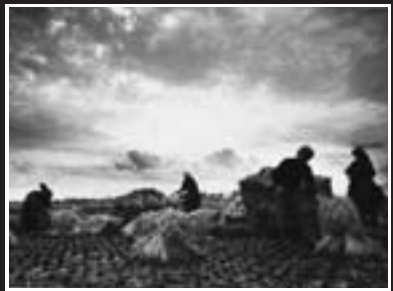
つがる市木造 1958年