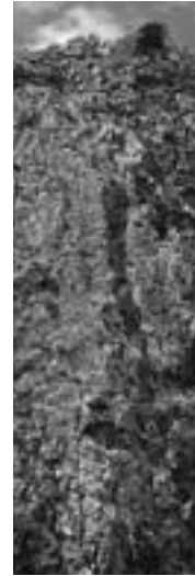
From the Banta (崖) series #007, 2008