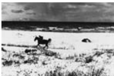
《疾走》下北地方 1961年頃

1980年代半ばから再評価の波が高まり、2004(平成16)年に初の本格的写真集『hysteric Eleven 小島一郎』(ヒステリックグラマー)が出版され、2008(同20)年、故郷の青森県立美術館で大回顧展「小島一郎—北を撮る」が開かれました。