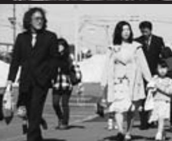
親子で入園式にお出かけ。長女のスツタンが幼児センターに新入園しました