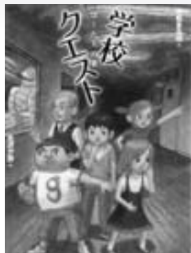
学校クエスト (児童書) 中松まるは / 著 童心社 / 刊

ロス市警のローランド刑事は、金に目がくらんだ同僚刑事に裏切られ、銃で撃たれてしまう。この裏切りによって人間不信に陥ったローランドは警察を退職し、元上官の娘のボディガードとしてニューメキシコへ向かった。しかし再び仲間の裏切りに合い、マフィアに娘を誘拐されてしまう。…(94分)