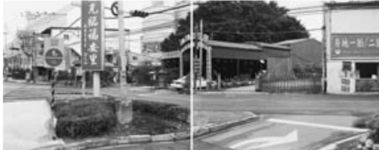
Heaven on Earth (天上人間) #4, 2009