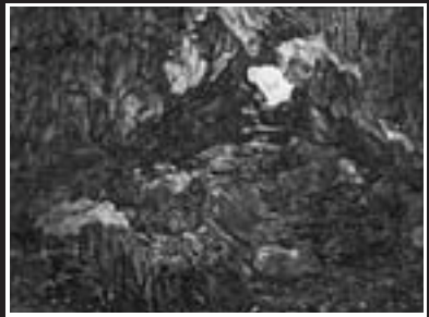
From the Banta (崖) series #007, 2008