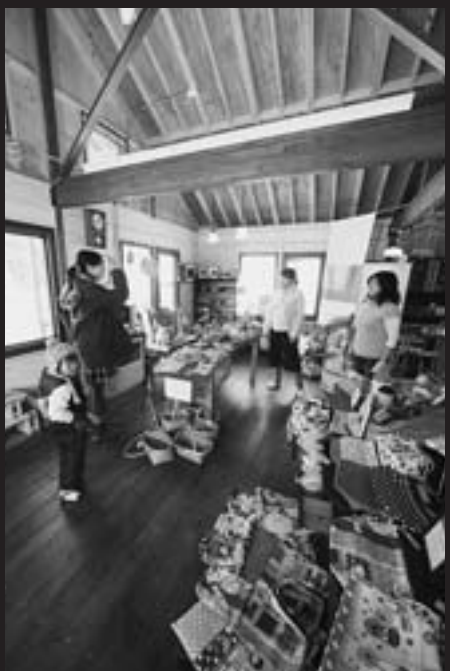
アトリエ「フォトシーズン」のショップ会場