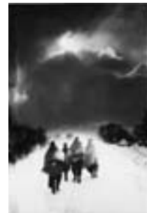
つがる市(稲垣付近) 1960年