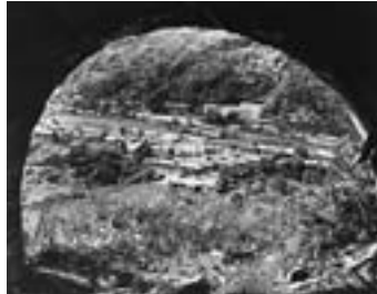
夕張定点観測 1983年 ズリ捨て線トンネルから社光地区を見る