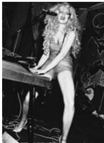
NEW YORK, 1982