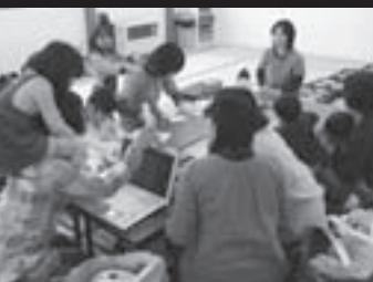
子供たちが遊びまわる中での作業です