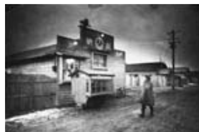
五所川原市十三 1957年