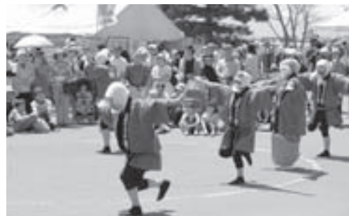
初登場の「稚内笑福芸能大黒ひよつとこ踊り」

5月22、23の両日、キトウシ森林公園で第48回くらし楽しくフェスティバルが開かれました。 2日間とも好天に恵まれ、気温もセ氏23度まで上がって絶好の祭り日より会場は朝から家族連れでにぎわい、子供用服、日用雑貨などのフリーマーケットは大勢の来客で混雑しました。 春は家庭菜園、花壇づくりのための苗選びを待ちわびていた来場者で、野