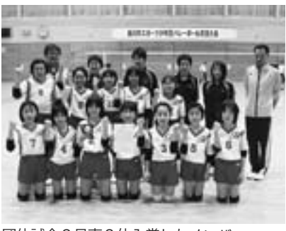
団体試合3見事3位入賞したメンバー