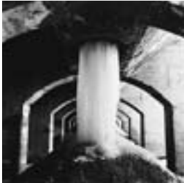
手稲鉱山 札幌市 2000年

2009(同21)年、目黒区美術館(東京)の「文化」資源としての炭鉱」展で、1983(昭和58)年に撮影した写真と同じ場所を2008(平成20)年に再度撮影した「夕張定点観測」の写真を発表。