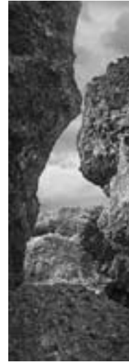
From the Banta (崖) series #017, 2008