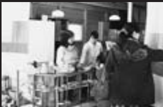
地元で作った手づくりパンなども大好評