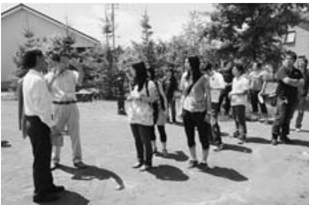
景観条例に配慮した住宅団地を見学(グリーンビレッジで)

7月23、24の2日間、酪農学園大学(江別)の学生が東川町を訪れ、町内各所を見学しました。