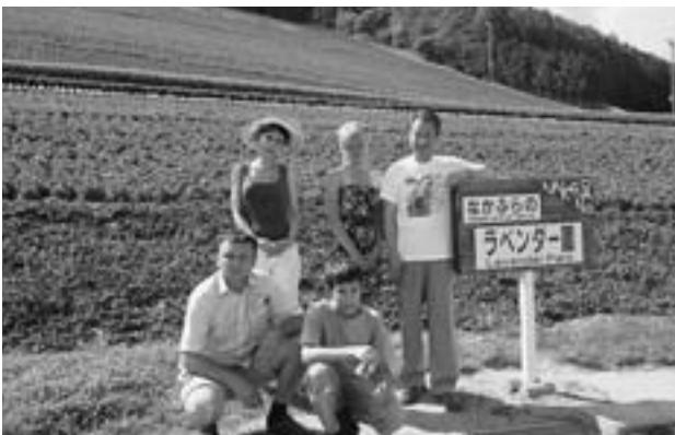
満開のラベンダー畑を訪れた一行(16日、中富良野町)

ベラルーシ共和国の白血病の発生率は、現在世界平均の4倍。フラコビツチ村では白血病発生率が住民の75%に及んでいるそうです。