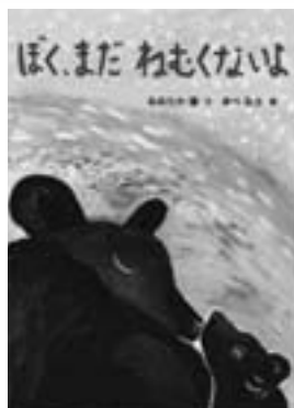
ぼく、まだねむくないよ(絵本) おおたか蓮/作 あべ弘士/絵 童心社/刊

ドームふじ基地へ南極観測隊の料理人としてやってきた西村。限られた生活の中で食事は別格の楽しみだ。手間暇かけて作った料理を食べて、みんなのほころぶ顔をみる瞬間はたまらない。しかし日本には8歳の娘と生まれたばかりの息子が待っている。これから約1年半、セ氏氷点下54℃の地で、14,000キロ離れた家族を思う日々がはじまる。(125分)