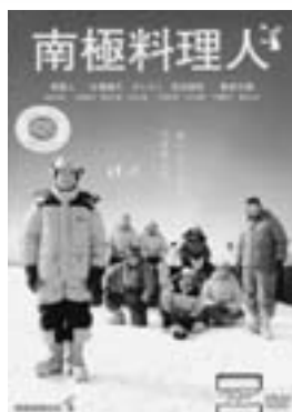
南極料理人 (映画、DVD) ポニーキャニオン

文化交流館では、図書室に所蔵されていない本や映画DVDのリクエストを随時受け付けています。ご希望の本、映画DVDがありましたら、司書カウンターに備え付けてある申し込み用紙に名前をご記入の上お知らせください。ご希望の図書は新たに購入、または他地域の図書館から取り寄せ、できるだけ迅速に対応します。ただし映画DVDは、著作権の関係上すべてのご要望に応えられない場合がありますのでご了承ください。調べもの、図書室に関する質問もお受けしています。交流館職員までお気軽にご相談ください。