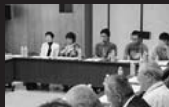
宮崎応援企画が具体化した今年のおてっぺん祭り企画会議(7月13日、農協で)

野菜類を並べ始めると、町内の方が待っていたかのように新鮮な野菜を買いに来るのですが、観光最盛期のこの時期は、店開き前から観光客がテント前に集まります。9割は観光客。今日も元気な声が響いています。