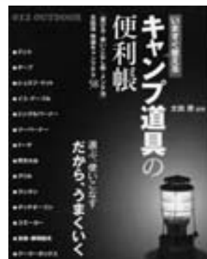
キャンブ道具の便利帳(一般書) 太田潤/監修 大泉書店/刊

冷たい雪におおわれてしまった森。母さんグマは子供と冬眠を始めます。でもグマは「まだねむたくないよ」とひとり外へ出て行ってしまいました。するとあたりは一面の雪。ズボズボ沈んで動けなくなったグマはユキウサギに出会って…。平成22年度北海道指定図書に選ばれているお勧めの一冊。読書感想文を書くのにいいですよ。