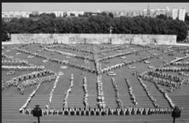
小学生から高校生まで参加して行われる「歌と踊りの祭典」(リガ市内のダウガスタシアンで)

昨年7月、インデックスプログラムで東京、大阪、京都、和歌山に約3週間滞在しました。「日本はとてもきれいな国。ラトビア人にとって日本はとても遠い国だけれど、日本の文化をもっとラトビアに紹介したい。ラトビアの子供たちに日本に来るチャンスを広げてあげたい」と思っています。