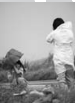
▲宮城県柴田農林高校 (第3ステージ、美瑛町北瑛地区)