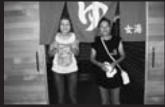
来町してさっそく町内の温泉を満喫しました(旭岳温泉)