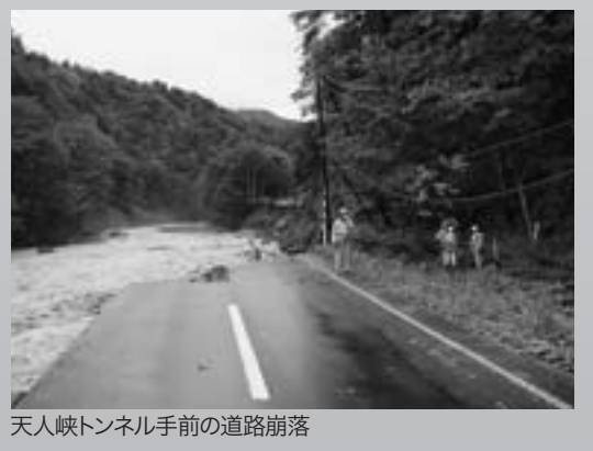
天人峡トンネル手前の道路崩落

また道道旭川旭岳天人峡線は旭岳温泉に向かう上忠別橋の橋げたが約10メートル崩れ落ち、忠別湖に沿って両温