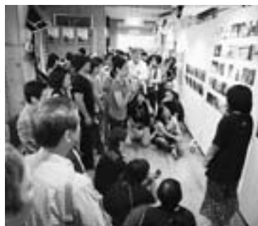
▶写真インデペンデンス展合評の集い（7月31日、文化ギャラリー）

作家作品展会場となった文化ギャラリーの受賞作家フォーラムでは、作品に込めた作者の思いなどを話し合いました。会場ではそのほか、若手の写真家が自らの作品を持ち寄って批評やアドバイスを受けることができ、写真インデペンデンス展、ポートフォリオレビュー、ストリートギャラリーフォトコンテストや、初の室内モデル撮影会、まち撮り撮影会、ポートフォリオレビューツアー、「ユナナ21・クロッシンガカオス・1999-2009」