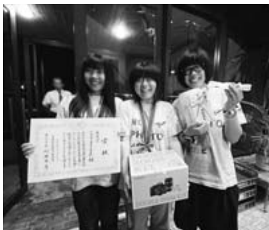
▲町民特別賞の帯広南商業高校