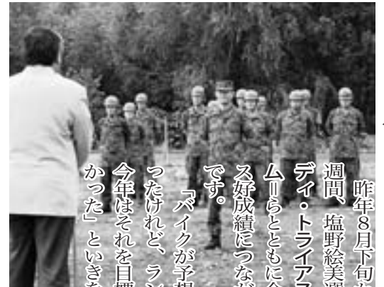
陸上自衛隊第2特科連隊第5大隊の24人が大会支援に縁の下で大活躍してくれました

バイクが予想より1分ぐらい遅かったけれど、ランは去年より速かった。今年はそれを目標にやってきたので良かった」といぎを弾ませました。