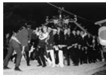
第4回ひがしかわ大写真展 町民一般部門