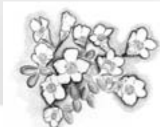
▲イワウメ=花が多く見られるのは6月後半～7月前半。8月末ごろから葉が赤くなる。この植物がある場所は大抵風が強い場所

6月中や9月初旬でも雪や吹雪となる日があります。厳冬期は強風で雪が飛ばされるため、気温が氷点下数十度の空気との間で緩衝材(雪)がありません。高山でも特に環境条件