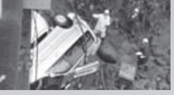
上忠別橋の道路崩落

8月23日夜から翌日の24日未明にかけて、旭岳・天人峡地区にゲリラ豪雨が降り、両地区を結ぶ道路が3カ所で寸断されました。両温泉に宿泊していた観光客730人余りと旅館従業員など関係者が一時孤立しました。車4台が増水した忠別川に転落、旭岳温泉の駐車場監視員の男性（41）、美瑛町内の電気工事業者の男性（60）の2人が犠牲になりました。旭岳・天人峡地区の降水量は、最も近い忠別川下流の東