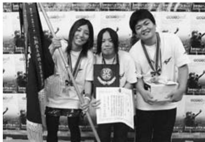
▲2連覇優勝した沖縄南部工業高校