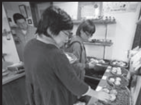
旭川市内からのお客さん、2回目の来店です。