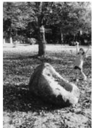
第5回ひがしかわ大写真展 町民一般部門