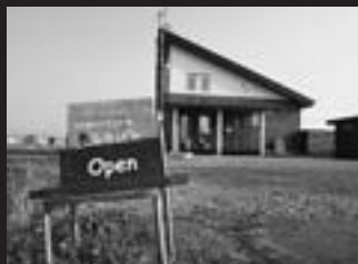
田んぼの中の小さなお店