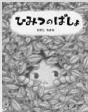
ひみつのはしよ(絵本) 作/ひがしちから 刊/PHP研究所

リー・アンは、自宅に帰る途中、雨に濡れながら真冬の夜道を歩く黒人の少年にふと目を留めた。彼の辛い境遇を知り、家族として迎え入れる。リー・アンはやがて、大柄であるにもかかわらず敏捷(しろう)な肉体と、仲間を危険から守る保護本能に秀でた心を持つ少年に、ある才能を感じる。ホームレス同然の生活からアメリカン・フットボールのプロ選手になった少年の実話を元にした感動ドラマ。(128分)