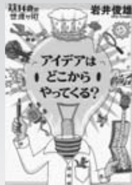
アイデアはどこからやってくる? (児童書) 著/岩井敏雄 刊/河出書房新社

公園でふしぎなしげみに入ってみた、さやちゃん。「すてきなばしよ、みーつけた!」。しばらくすると、あたりがざわざわとしてきました。耳をすませてみると、はつばのすき間からくまさんが大きな目をのぞかせ話しかけてきます。さやちゃんはいつかこの場所でパーティをひらくことを約束して…。自分だけの「ひみつのはしよ」を探してみたくなる、想像力が広がる絵本。