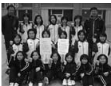
▲バレーボール少年団新人戦3位

◆第30回旭川小学生バレーボール大会新人戦(2月6日・旭川市忠和体育館) ③東川ジュニア