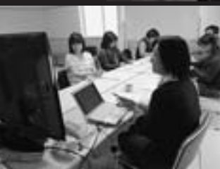
「障害のこともっと知ろう」研修会(こころんく東川)