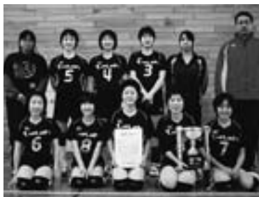
▲東川中バレー部優勝