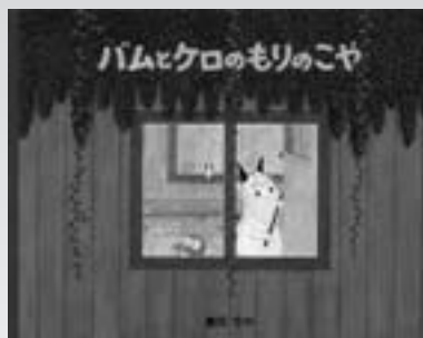
バムとケロのもりのこや(絵本) 著/島田ゆか 刊/文溪堂

失恋のショックで声を失つた倫子は、子どものころからなじめなかつた自由奔放な母が暮らす田舎へ戻り、小さな食堂を始める。お客さまは一日一組だけ。決まったメニューはなく、お客さまとの事前のやりとりからイメージを膨らませて作る倫子の料理は、食べた人の人生に小さな奇跡を起こしていく。(119分)