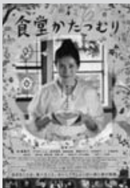
食堂かたつむり (映画、DVD) アミューズソフト

貸し出し期間は、図書は1人5冊まで14日間、ビデオは1人2本まで4日間です。返却期間を守りましょう(夜間返却窓口もご利用ください)。