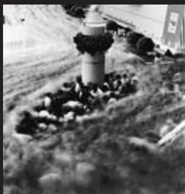
東京ドーム/東京 1990 Tokyo Dome, Tokyo