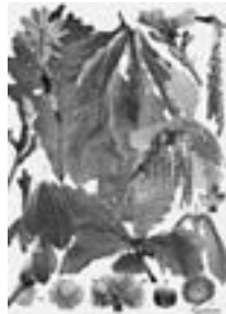
カシワ Quercus dentata 果実を包みこむ殻斗の鱗片にもカシワの 息づかいが聞こえる 2007-10年