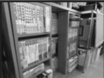
参考の資料・コミック誌が書棚にいっぱい