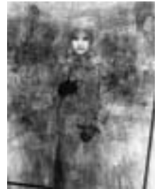
アニメのコスプレの少女たち34人を重ねた肖像 台北市のコミケ、ストリート上で 台湾 2009年4月18日撮影