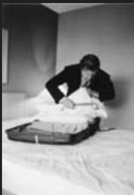
from: Business Class, 1996 ©ピーター・ドレスラー Peter Dressler