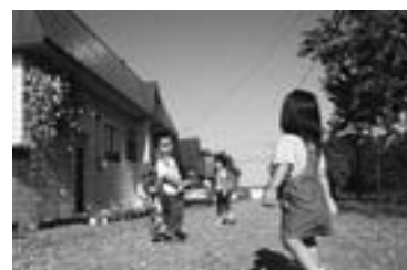
第5回しがしかわ大写真展 町民一般部門 佳作 「いってきまへす」 加藤桂子さん撮影