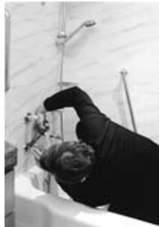
"Business Class" シリーズより 1996年

1942 (昭和17) 年ルーマニア・ブラショフ生まれ。1966 (同41) - 71 (同46) 年ウィーン美術アカデミー入学 (美術)。1980 (同55) - 83 (同58) 年、「オーストリア写真の歴史」展を共同企画、カタログに寄稿。1989 (平成元) 年、オーストリア連邦から写真文化功労賞。2001 (同13) 年、ルペルティヌム近代美術館 (オーストリア・ザルツブルグ) 写真賞。