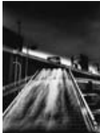
「溶悠する都市 / FLOW AND FUSION」 渋谷 / 東京、1991