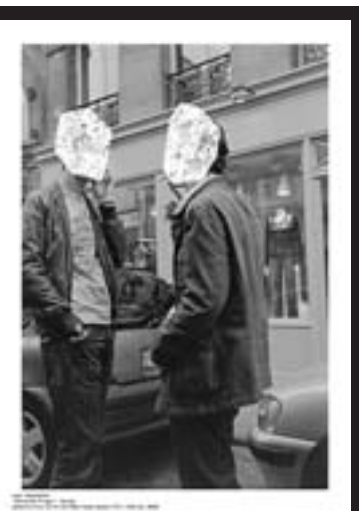
11番目の指, No.2, 2006