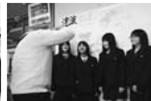
石巻市立女子高校