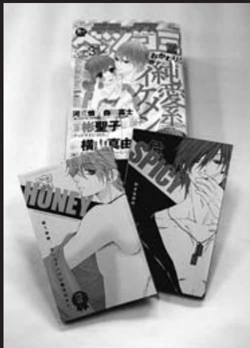
プロ作家へのデビューとなった「ベツコミ」誌