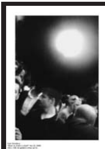
真珠のつくり方, No23, 2000