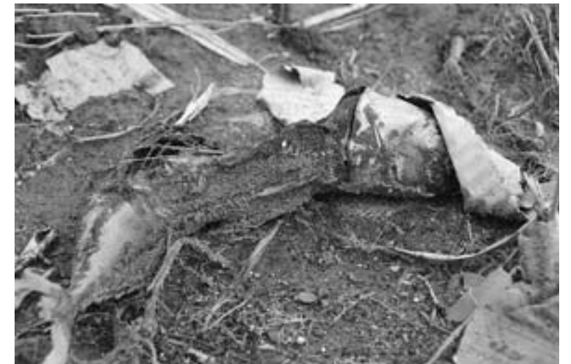
約400m離れた港の加工場から流れ着いた魚が異臭を放っていました