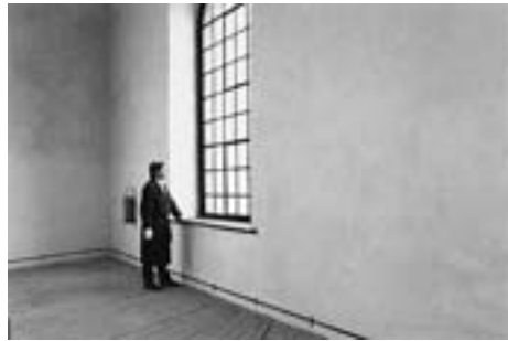
"Tie Break" シリーズより