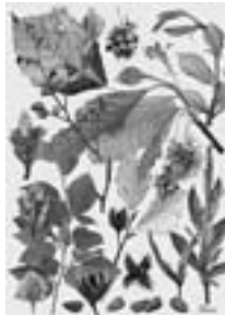
ブナ Fagus crenata 黄葉の盛りを過ぎて鉄さび色に沈んだ ブナの森が大好きである 2007-10年

1948 (昭和23) 年埼玉県本庄市生まれ。全国の自然風景撮影のかたわら、高山植物を題材に大雪山の撮影を始める。1986 (同61) 年、東川町に仕事場を構え、大雪山と周辺の自然撮影、北海道の森林を心象風景で表現することが撮影テーマ。公益社団法人日本写真家協会会員。