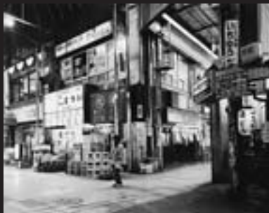
大阪 都島区京橋 2008.3 Osaka Kyobashi Miyakojima Ward 高校時代、通学の乗り換え駅だった。 成人して父と一度だけ飲んだ場所 ©百々俊二 Shunji Dodo