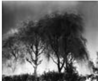
「溶悠する都市 / FLOW AND FUSION」 柳 / 晴海 東京、1995