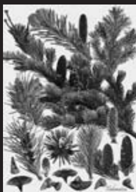
トドマツ Abies sachalinensis 美しさは針葉の色あい重なった緑の奥深さ