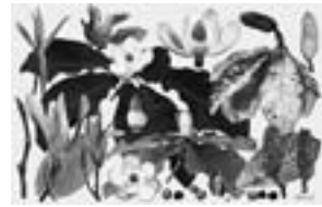
ホオノキ Magnolia obovata 気品漂う花の咲き姿はまさに森の女王 2007-10年