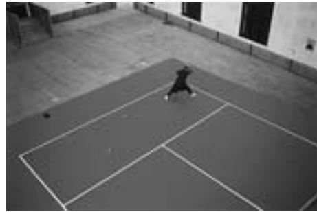
"Tie Break" シリーズより