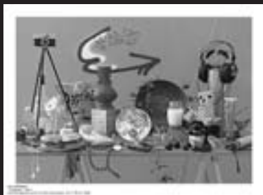
12 Speed, CO-7, 2008 ©オノデラユキ Yuki Onodera