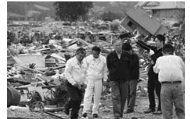
津波被害のすさまじさにあ然とする松岡町長ら