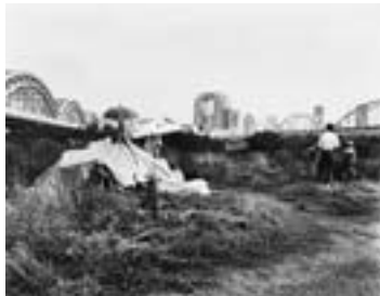
淀川区淀川河川公園2008.5

1947 (昭和22) 年大阪生まれ。九州産業大学写真学科卒業。東京写真専門学校教員を経て'72 (同47) 年から大阪写真専門学校 (現ビジュアルアーツ専門学校) 教員、'98 (平成10) 年から学校長。'96 (同8) 年、『楽土紀伊半島』(ブレーンセンター刊) で日本写真協会年度賞。'99 (同11) 年、『千年楽土』(同) で第24回伊奈信男賞。2007年、日本写真芸術学会芸術賞。2011年、写真の会賞。