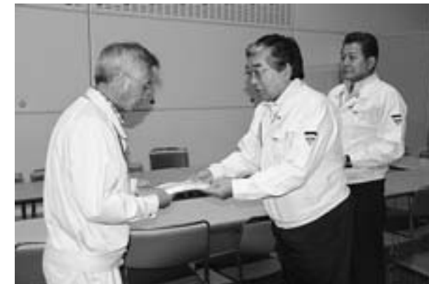
町、町議会議員一同から猪狩副村長(写真左)に義援金を手渡しました