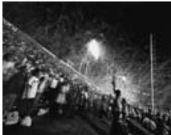
西宮市甲子園2008.9 リニューアル前の甲子園アルプススタンド、 7回裏ジェット風船。私にとって甲子園は大阪だ