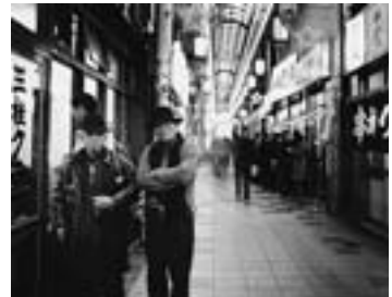
浪速区恵比寿ジャンジャン横町 三柱クラブ外 2010.1 三柱クラブから出てきた将棋仲間