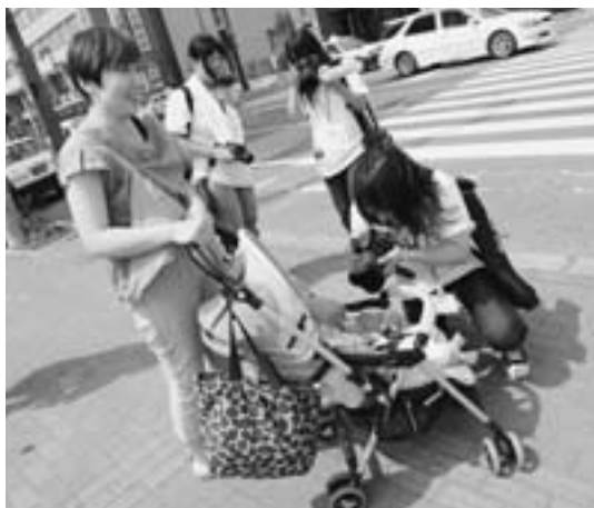
▲赤ちゃんの寝顔に思わずシャッター=盛岡中央高校 (7月27日、旭川市1条買物公園で)