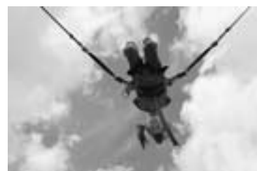
第5回ひがしかわ大写真展 町外一般部門 準グランプリ