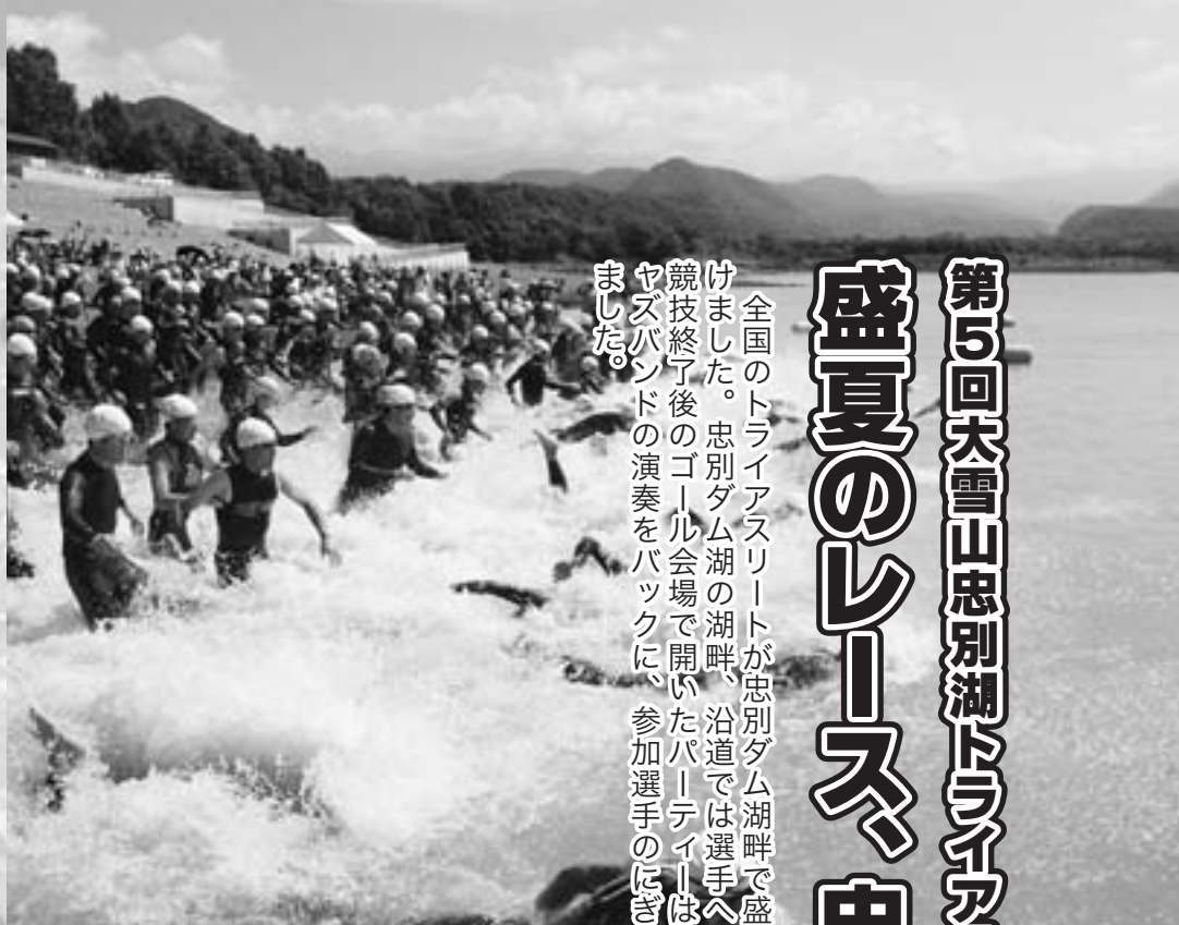
ため直前にコース変更になり、バイク

全国のトライアスリートが忠別ダム湖畔で盛夏のレースを駆け抜けました。忠別ダム湖の湖畔、沿道では選手への声援もいっぱい。競技終了後のゴール会場で開いたパーティーは、旭川から訪れたジャズバンドの演奏をバックに、参加選手のにぎやかな交流が広がりました。