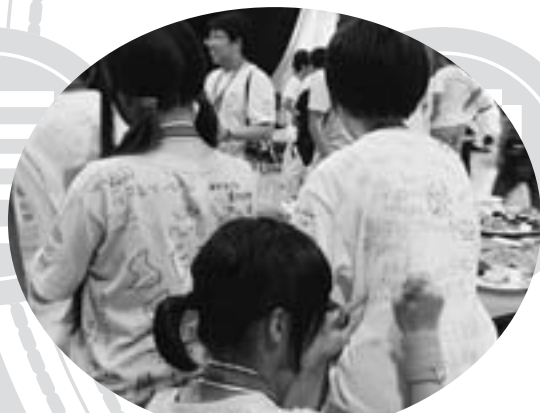
▲大会が終わってそれぞれのTシャツに別れの寄せ書き (7月29日、農村環境改善センター)