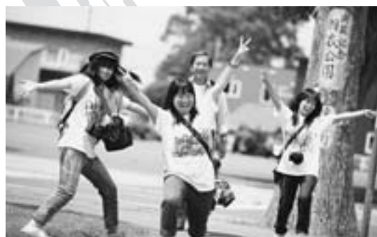
▲「さあ、いくぞー！」(決戦前の兵庫県立伊丹西高校、7月26日、農村環境改善センター前)