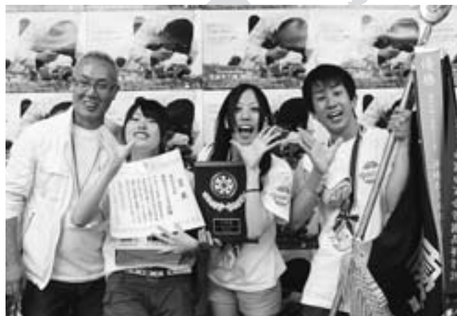
▲優勝した大阪府立成城高校