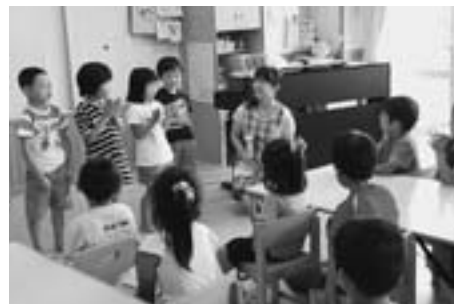
二本松市の子供たち(幼児センター)