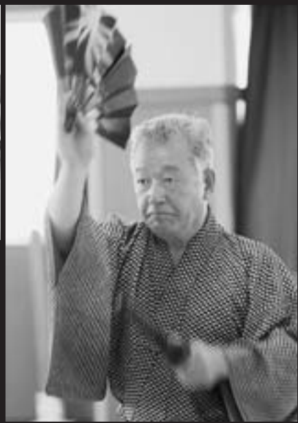
全国大会出場に向けて連日猛練習しています (B&G海洋センター)