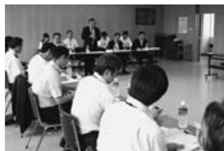
町は昨年の災害後、復旧事業とともに、情報伝達の経路複雑化、天人峡旭岳両地区へ衛星通信携帯電話を配備、町内、近隣店舗と応急生活物資の供給協定締結、町建設業協会と災害時応急対策協定など、自然災害に備えて全町災害予防計画の見直しを進めてきました。

会議室で東川町防災会議、東川町国民保護協議会を開き、大規模自然災害に備えて取り組みが必要な防災計画見直しの進め方などを話し合いました。