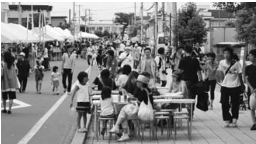
▲どんとこいまつりの東町一丁目通りは今年も大にぎわい

写真の祭典・フォトフェスタ2011の「第18回写真甲子園」「第27回東川町国際写真フェスタ2011」が今年もにぎわいました。写真の祭りに花を添えるどんとこい祭りも天候の崩れなく、大勢の来場客でにぎわいを見せました。