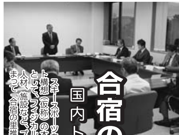
▲10月、役場で開いた準備会