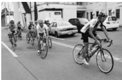
▲東京ヴェルディ、トリアスロンセッションチームは、今年から本格的な夏季合宿練習に来町しました(今年8月、町ふるさと交流センター前)

今年には東京ヴェルディ・トリアスロンセッションチームも3週間の夏季合宿に訪れました。忠別湖トライアスロン大会の開催定着に伴って、個人で町内練習をする方も増えています。