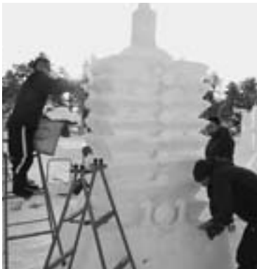
▲雪像コンクール優秀賞を受賞した台湾留学生チームの「台湾101タワー」制作風景(1月20日)