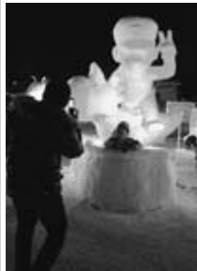
▲雪像コンクールで優勝した環境福祉専門学校の「マリオ&ヨッシー」