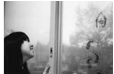
第5回しがしかわ大写真展 町民一般部門 「君のしている風景」