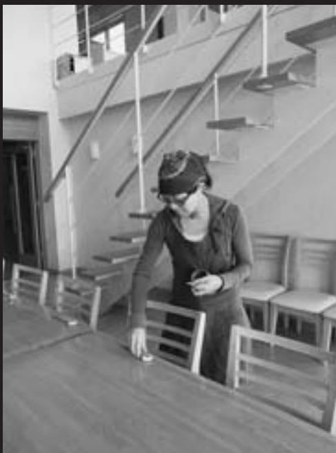
忙しい時には旭岳温泉、白樺荘で接客も手伝い(昨年12月3日)

帰国して変わっていたのは「山ガール」の流行。「女性の登山ガイドなら、女性ならではの、のびのびもある。今シーズンからはガイドサポートしながら旭岳を中心に活動したいな。」