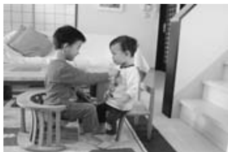
準グランプリ「お兄ちゃん先生、まじめに診察中」(カラー)