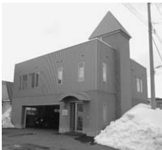
▲あさひ岳法律事務所

「法律的な知恵を持つている相手と交渉する時には、こちら側も知恵を持っていないとー。損をする人がいっぱいいます。損か得かは、経済的意味だけでなく、精神的な意味もあります。このような時弁護士としてどうアドバイスできるか。裁判所に適切な評価を求める時弁護士が必要な場合もありますよね。どうするのかはそれぞれが決めれば