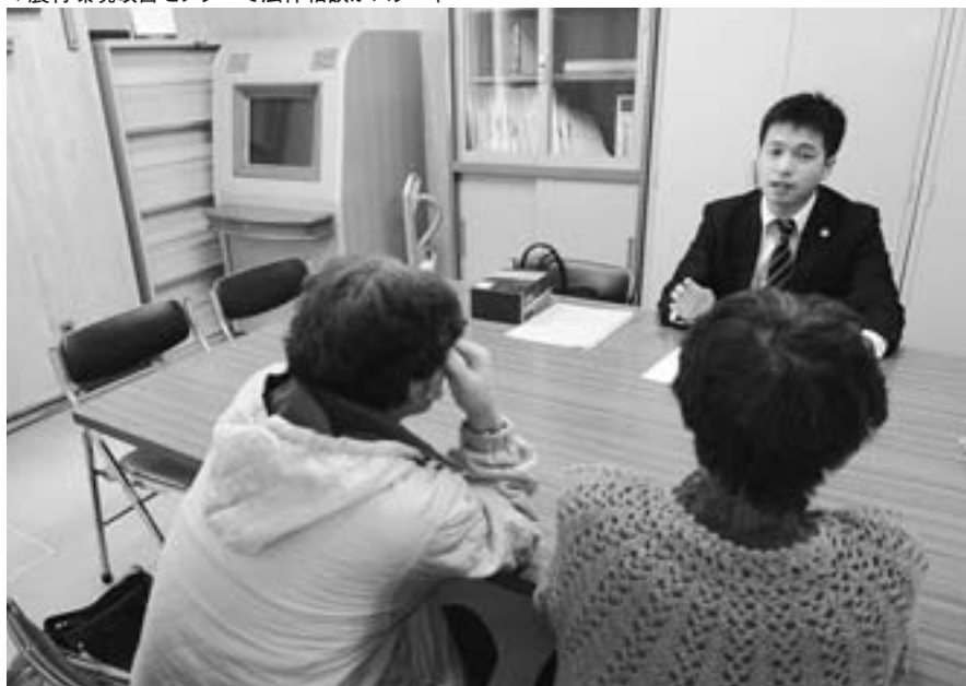
▼農村環境改善センターで法律相談がスタート

「法律的な知恵を持つている相手と交渉する時には、こちら側も知恵を持っていないとー。損をする人がいっぱいいます。損か得かは、経済的意味だけでなく、精神的な意味もあります。このような時弁護士としてどうアドバイスできるか。裁判所に適切な評価を求める時弁護士が必要な場合もありますよね。どうするのかはそれぞれが決めれば