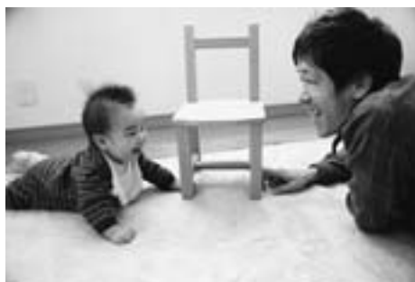
準グランプリ「僕の椅子～触れて感じる～」(セピア)