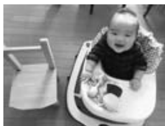
東川町長賞「僕の椅子」(カラー)