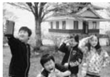
第6回ひがしかわ大写真展 町外一般部門 佳作 「なかよし 4人組」 岸 政継さん撮影