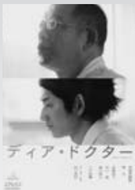
ディア・ドクター (映画、DVD) バンダイビジュアル

貸し出し期間は、図書は1人5冊まで14日間、ビデオは1人2本まで4日間です。返却期間を守りましょう(夜間返却窓口もご利用ください)。貸し出し検索がインターネットで可能になりました(貸し出し状況は画面に反映していません)。当館に問い合わせの上ご確認ください。☎(直)82-4245 http://www.lib-finder2.net/higashikawa/servlet/Index