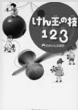
けん玉の技123 (児童書) 著/日本けん玉協会 刊/幻冬舎

山あいの小さな村。コンビニひとつなく、住民の半分が高齢者という過疎の地で、日々の診察、薬の処方から健康診断まですべてを一手に引き受けていた村でただひとりの医師が突然失踪した。警察がやってきて捜査が始まる。しかし、驚いたことに村人は誰ひとりとしてその医師のはっきりした素性を知らなかった。(127分)