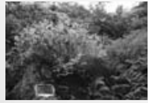
◀北大山スキー部慰霊碑(写真左下)

「早く積もれ」と積雪をあせりにも似た気持ちで待つ11月ですが、この時期、実は旭岳でも大きな雪崩事故が起きています。1972(昭和47)年11月21日夜、豪雪のさなか5人の山スキー部の大学生が盤の沢で雪崩にのみ込まれたのです。