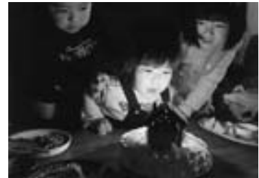
第5回しがしかわ大写真展 町民一般部門 準グランプリ 「ハッピーバースディ」