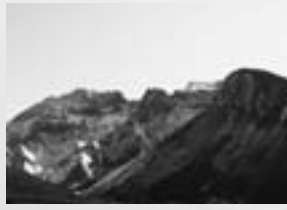
▶上ホロカメットク山の「化物岩」(写真右周辺)

急峻なだけに、この山域では雪崩事故がたびたび起きています。5年前の11月23日、右手前の、ちょっと頭巾のように見える「化物岩」の直下がなだれ、5人が死傷者したのは記憶に新しいところです。