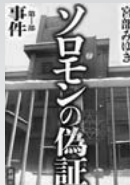
ソロモンの偽証 第一部事件 (一般書) 著/宮部みゆき 刊/新潮社

日本以外にも世界各国に愛好者がいるけん玉。その技は、なんと千以上あるといわれています。その中から厳選した123種の技を、日本けん玉協会がイラストなどで紹介。けん玉の持ち方と構え方、基本動作と技の構成なども解説します。初心者から上級者まで123種のスゴ技で、目指せけん玉キング!